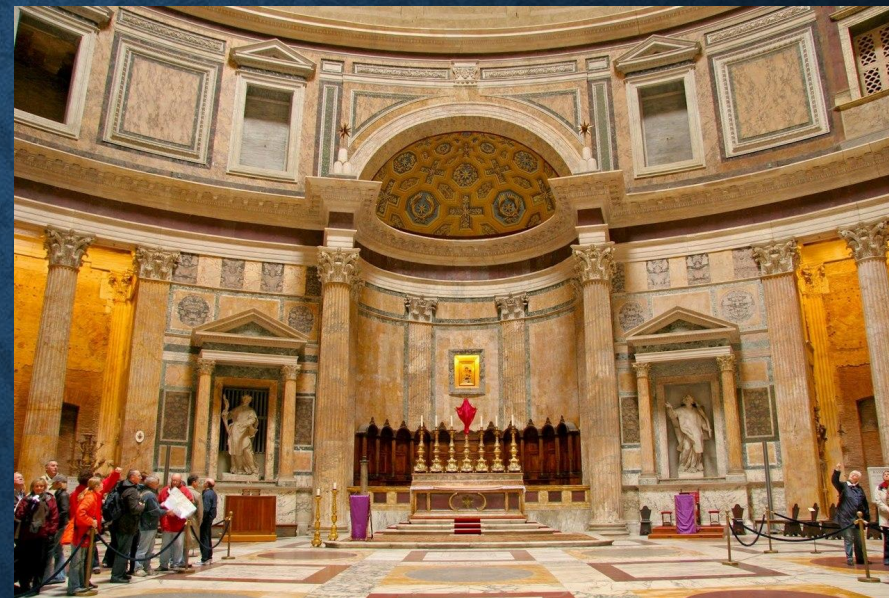
Вид внутри Пантеона