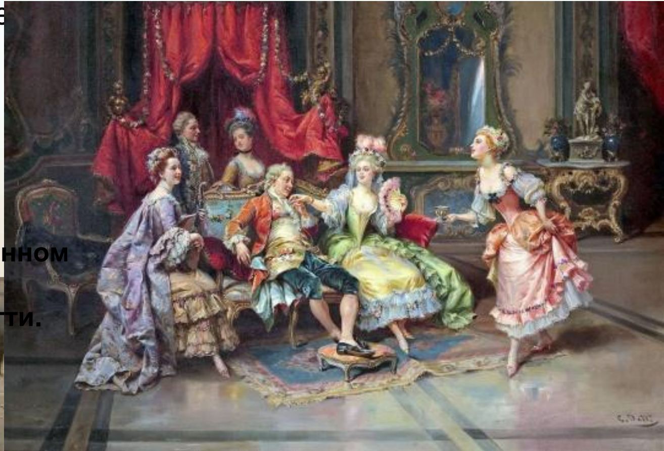
Людовик XV в тронном зале. Худ. Чезаре Детти.