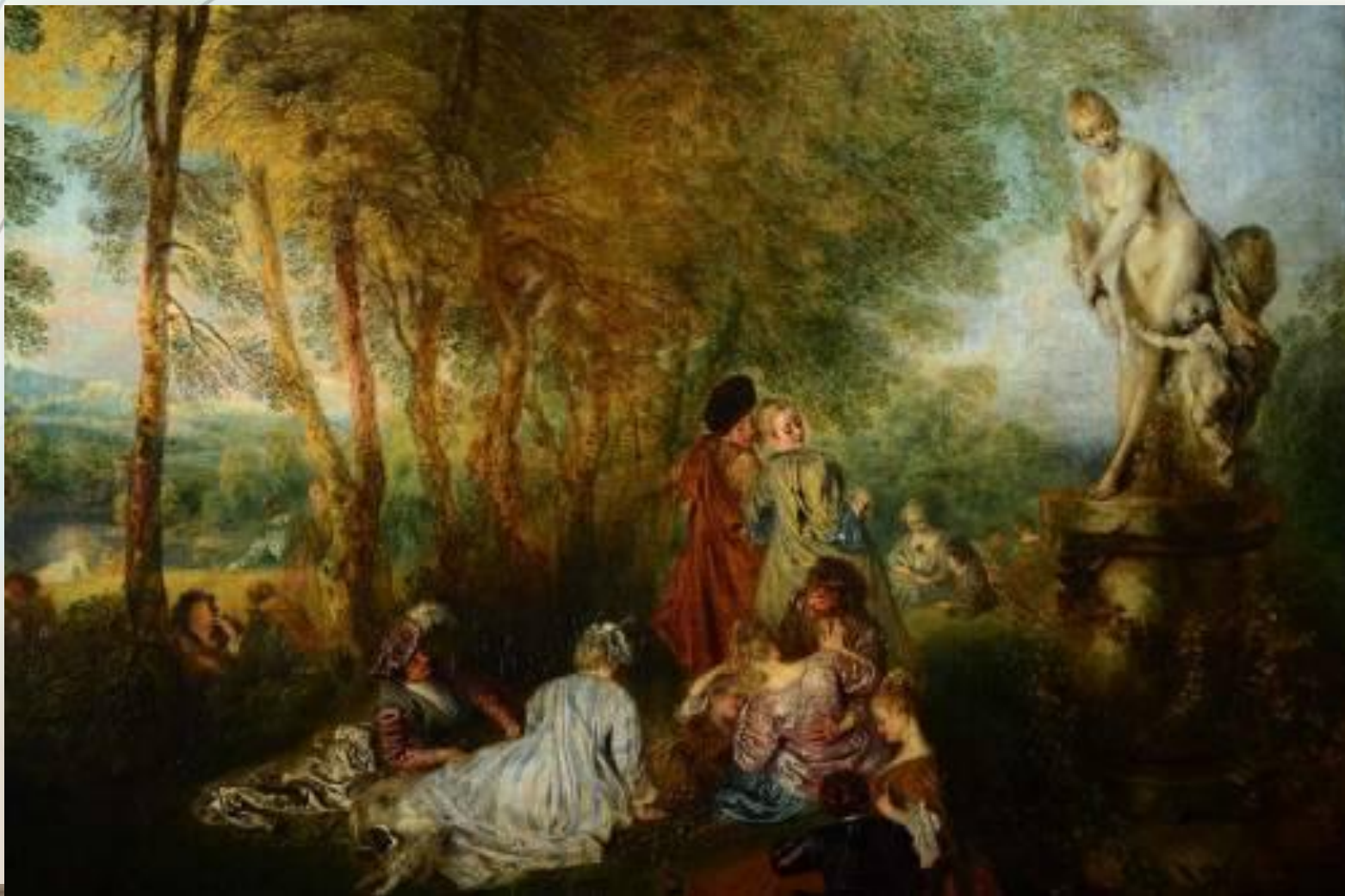
Праздник любви. Худ. А.Ватто.