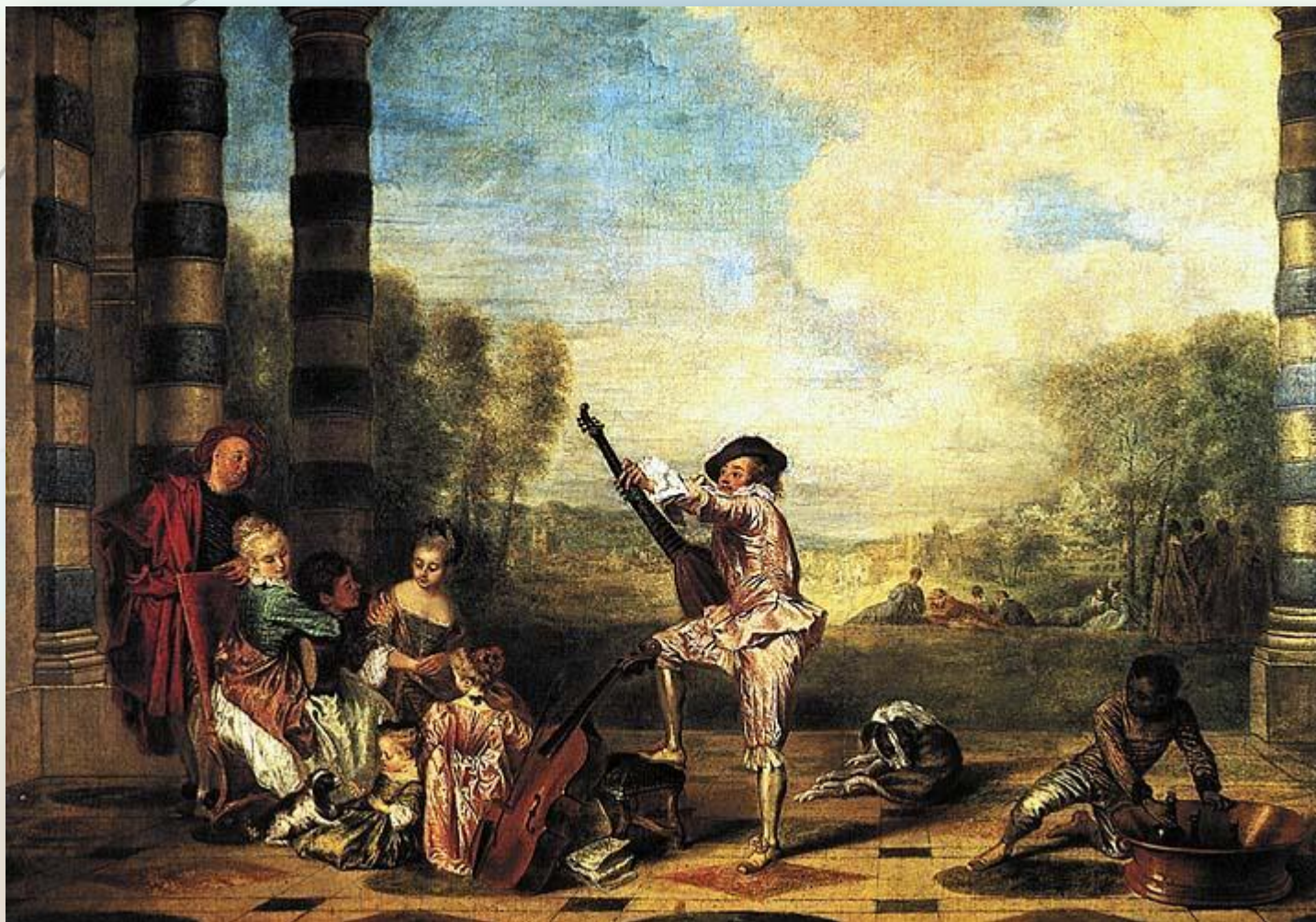
Прелести жизни. Худ. А.Ватто