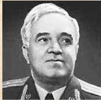
Александр Васильевич Александров

24 июня 1941 года газеты «Известия» и «Красная звезда» опубликовали стихотворение В. И. Лебедева-Кумача, начинавшееся словами: «Вставай, страна огромная, вставай на смертный бой...» Стихотворение в газете прочитал руководитель Краснознаменного ансамбля песни и пляски Красной Армии А. В. Александров. Оно произвело на него такое сильное впечатление, что он сразу же сел за рояль. На другой день, придя на репетицию, композитор объявил: - Будем разучивать новую песню - «Священная война».