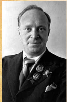
Василий Иванович Лебедев-Кумач

муз. А.В. Александрова, сл. В. Лебедева-Кумача