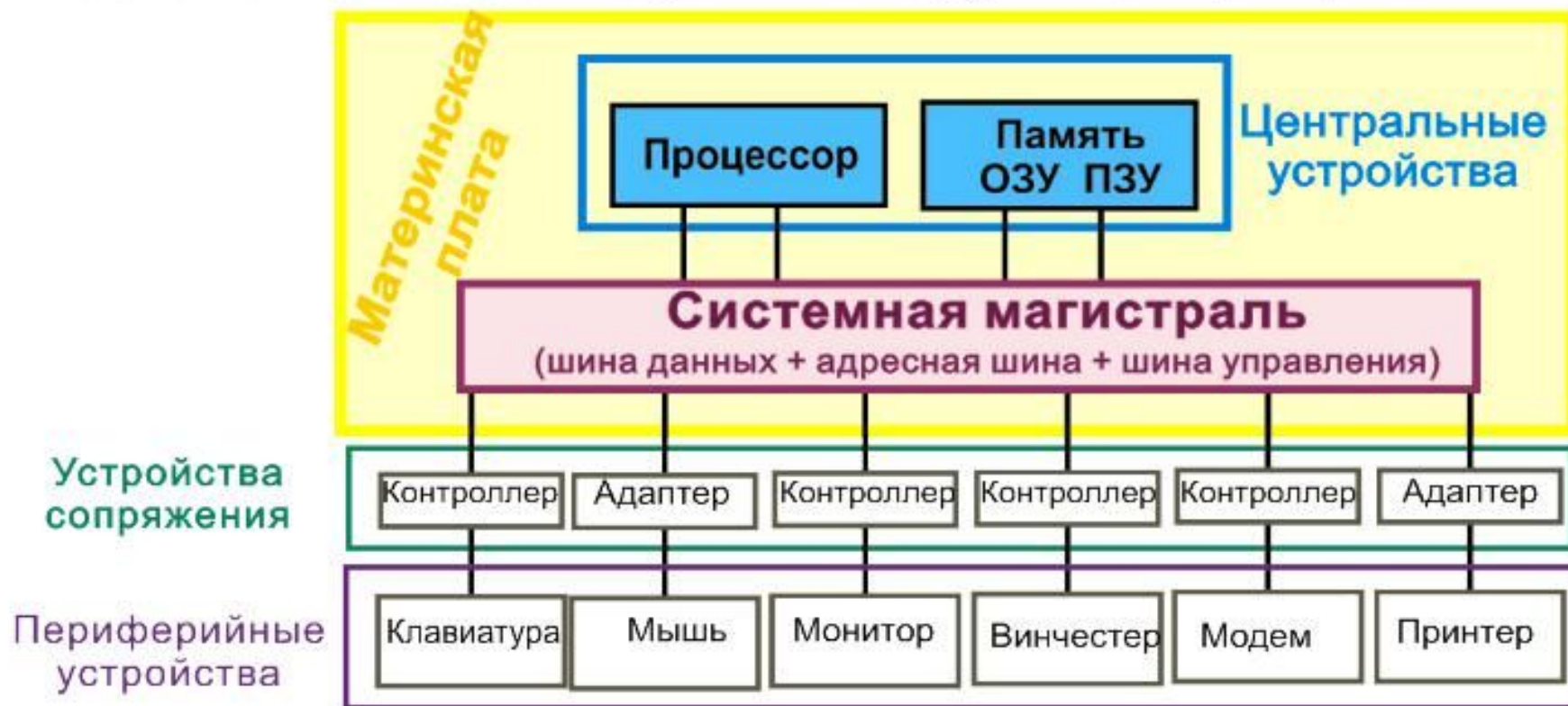
Схема архитектуры ПК, основанной на магистрально-модульном принципе