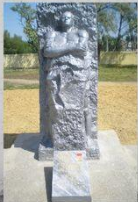
Каменск – Шахтинский