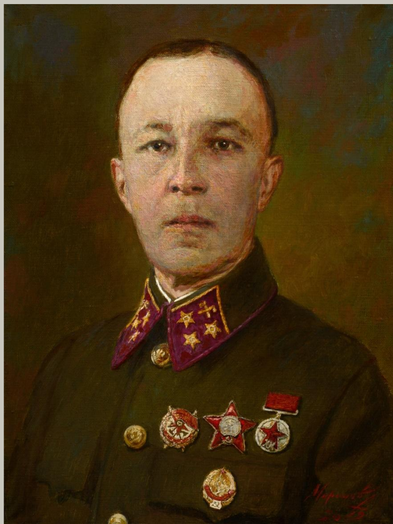
Карбышев Дмитрий Михайлович