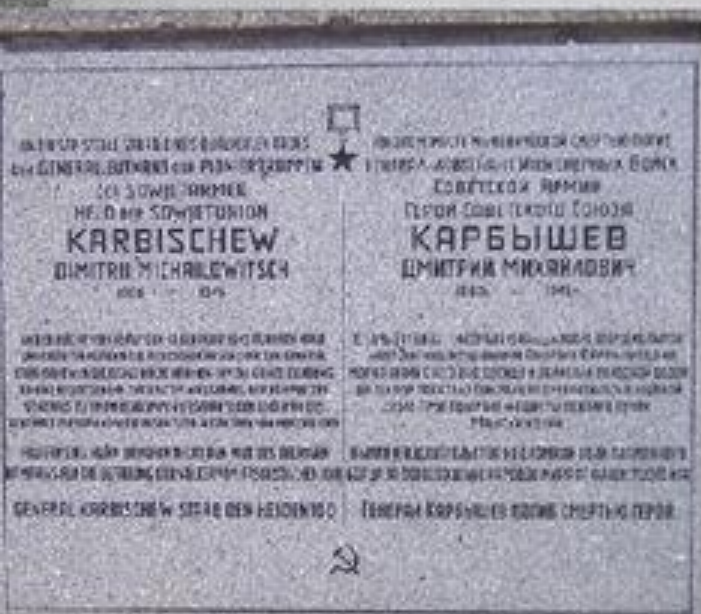
Стена плача в Маутхаузене

Труп генерала фашисты сожгли в печах Маутхаузена. пытки и издевательства не сломили волю пламенного борца за освобождение народов мира от фашистского ига. Генерал Карбышев погиб смертью героя".