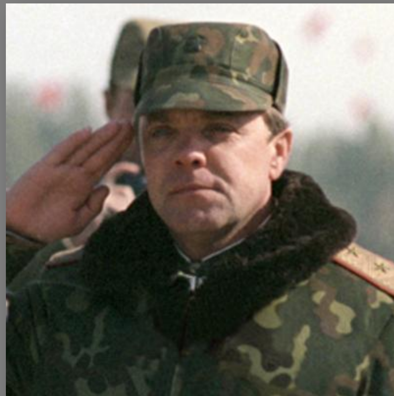
Борис Всеволодович Громов – генерал-майор