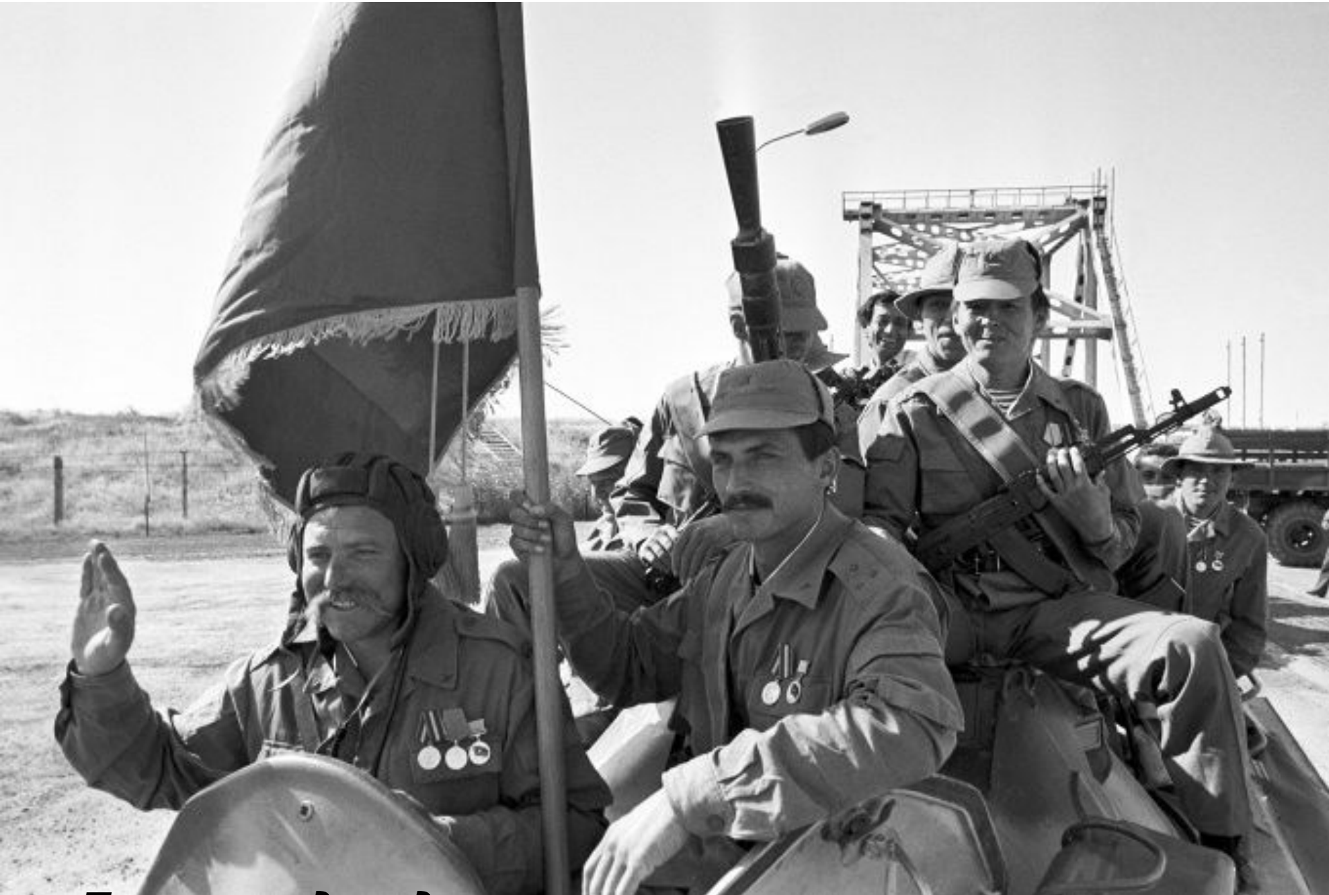
Первое подразделение ограниченного контингента Советской Армии, выведенное из страны