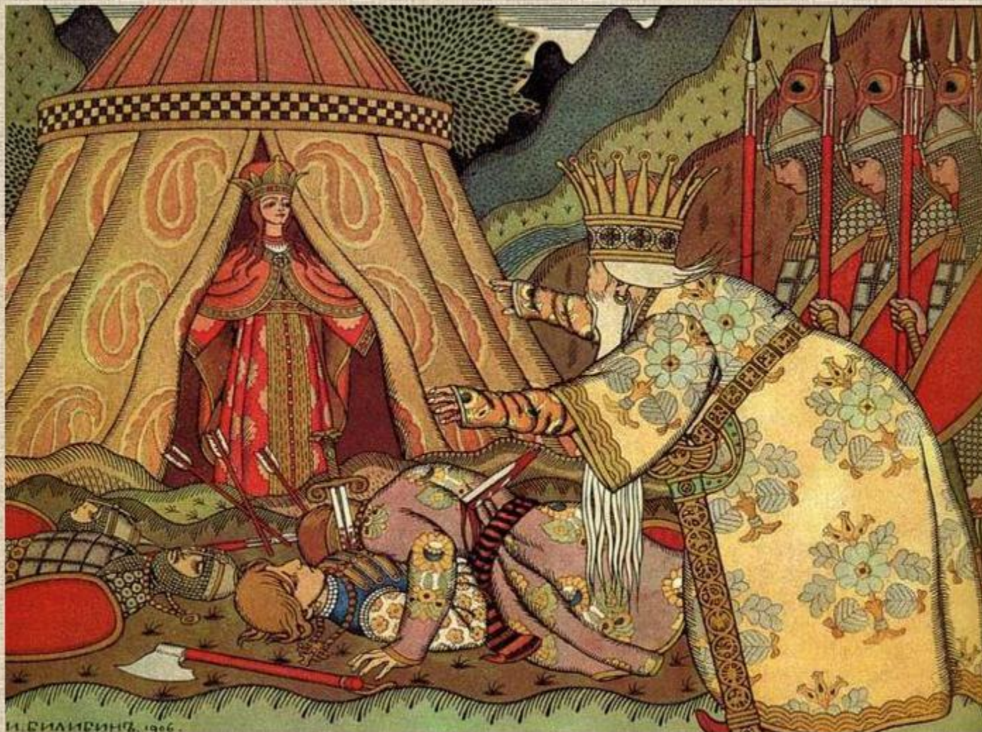
«Сказка о Золотом петушке»