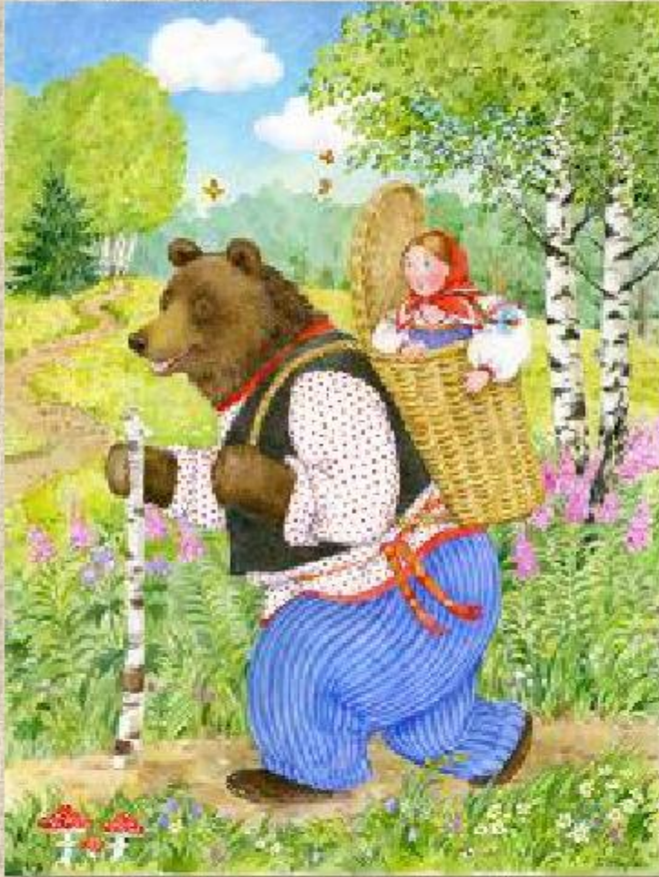
Иллюстрация вводит читателя в созданный художником образный мир, делает наглядным то, о чем рассказывается в книге - события и действия, повышает уровень эмоциональной атмосферы художественного восприятия, обогащает фантазию и воображение.