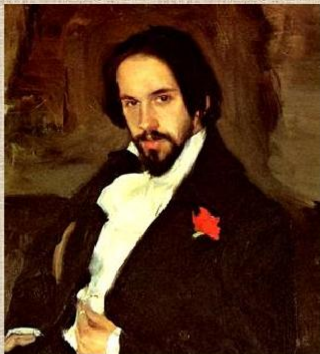
Иван Яковлевич Билибин (1876-1942)

И. Я. Билибин — русский художник -график и театральный оформитель, один из лучших иллюстраторов в истории русского изобразительного искусства.