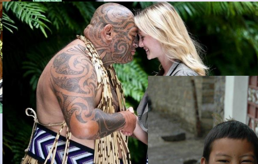
2. Коренные жители Новой Зеландии (маори) →