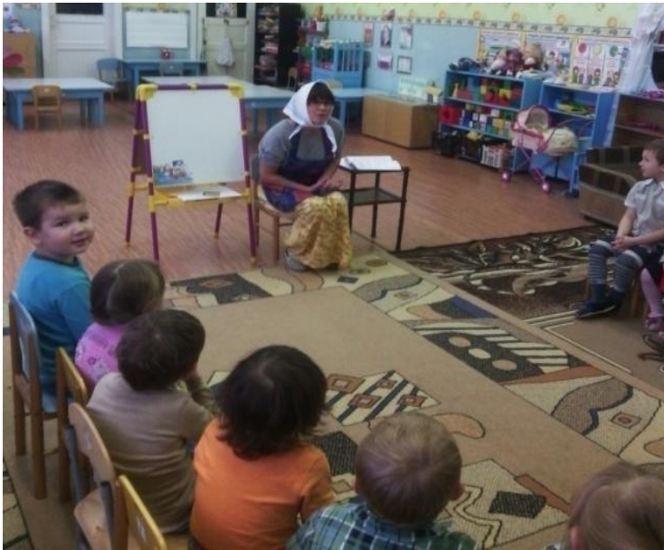
ООД с детьми «В гостях у бабушки»