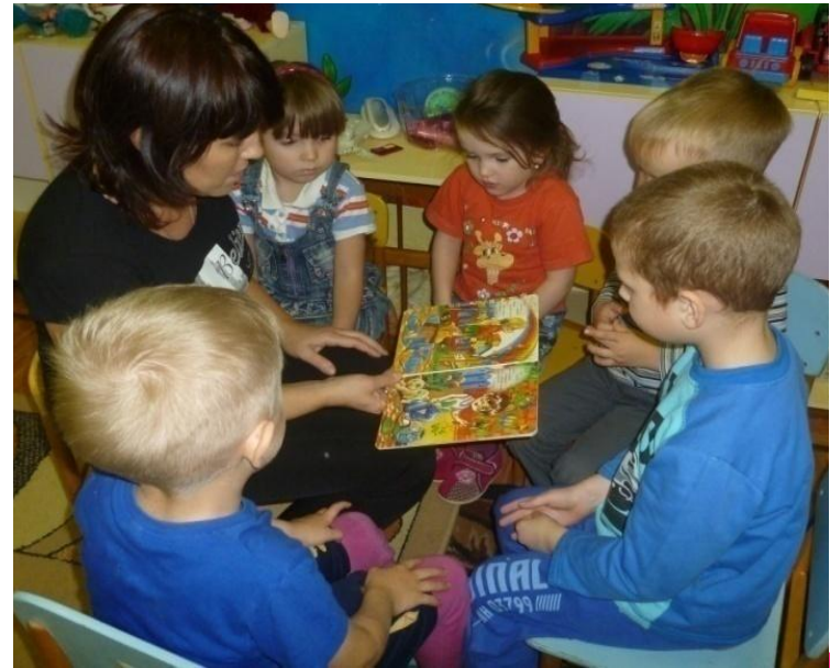
Чтение и обсуждение сказки В. Сутеева «Кто сказал «мяу»?»,