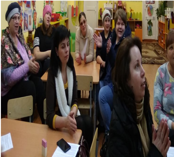
Родительское собрание «Роль семьи в формировании звуковой культуры речи младших дошкольников»