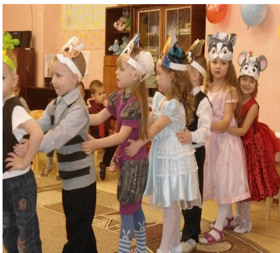
Участие в развлечении «По страницам любимых книжек»