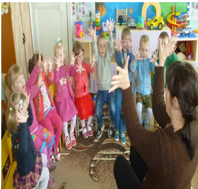
Пальчиковая гимнастика «Солнышко-вдрышко»

Здесь важную роль играет ритм. Речь детей сопровождается движением рук. Совокупность движения тела, мелкой моторики рук и органов речи способствует снятию напряжения, учит соблюдению речевых пауз, помогает избавиться от монотонности речи, нормализует ее темп и формирует правильное произношение.