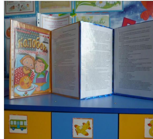
Папка – передвижка «Роль игр-инсценировок в речевом развитии детей»