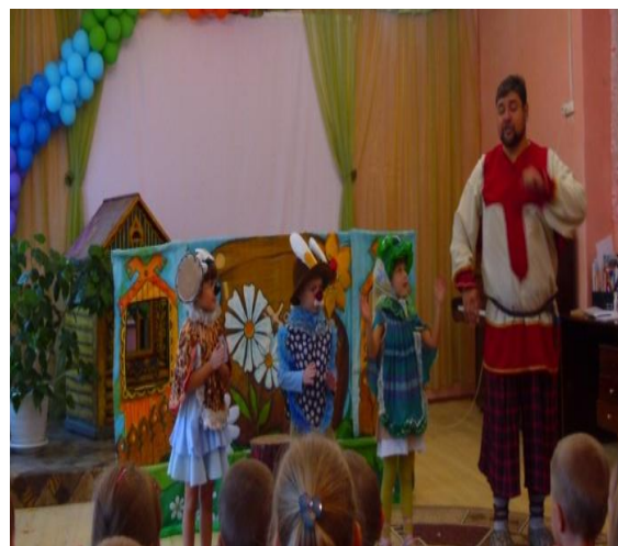
Кукольное представление «У солнышка в гостях»