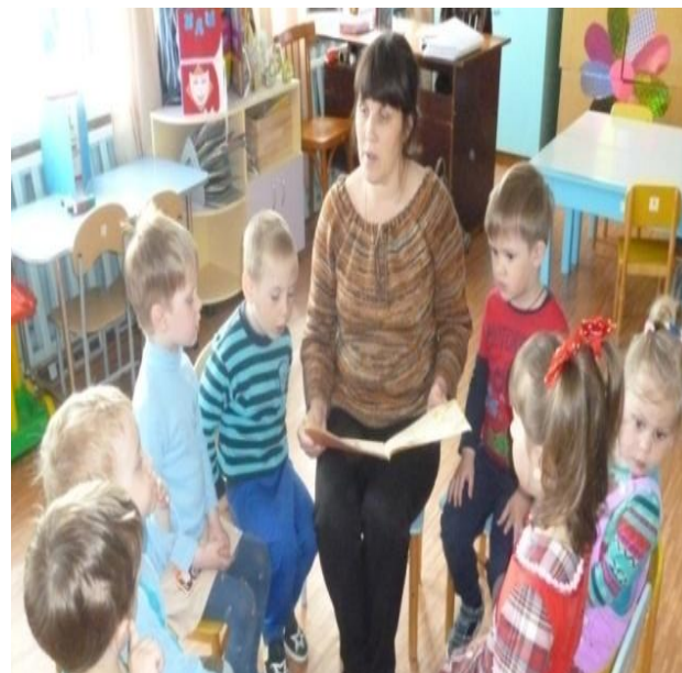
Чтение и заучивание потешки «Как у нашего кота»