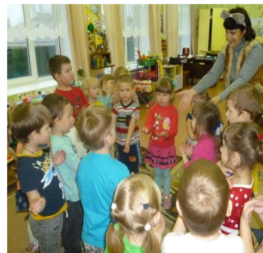
Развлечение «Кошкин дом»