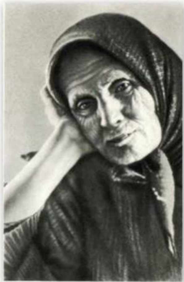
Шушун - женская верхняя короткополая одежда