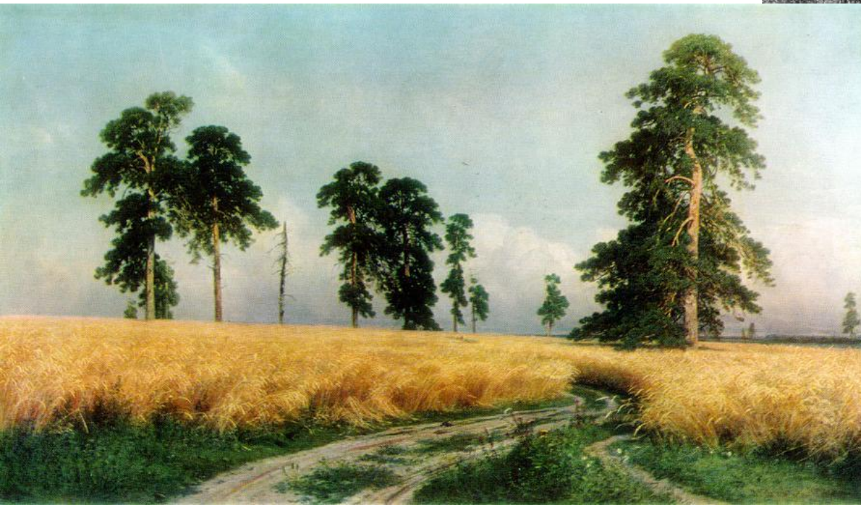
И. Шишкин «Рожь» (1878)