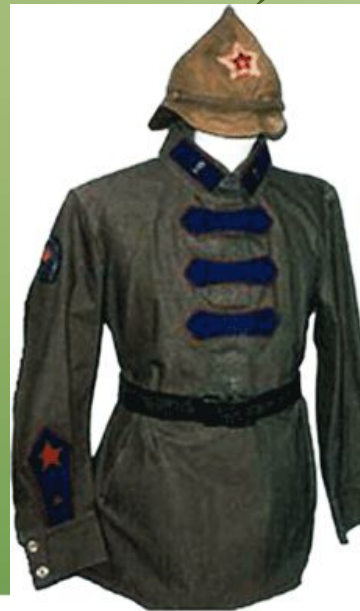
Форма сотрудника ОГПУ