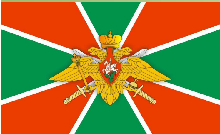
Флаг Пограничных войск Федеральной Пограничной службы России