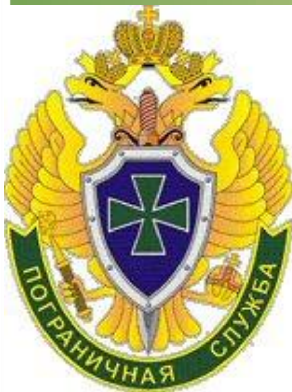
Эмблема пограничной службы ФСБ России

11 марта 2003 года функции ФПС переданы в ведение ФСБ России[4], при которой была создана Пограничная служба (преобразование вступило в силу 1 июля 2003 года).