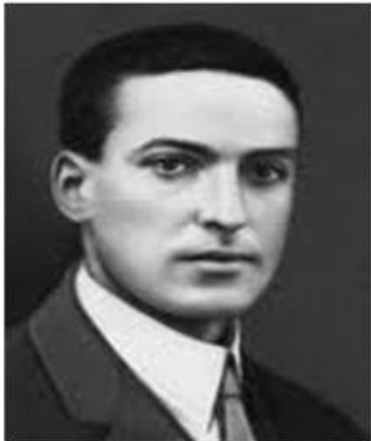
Выготский Л. С.