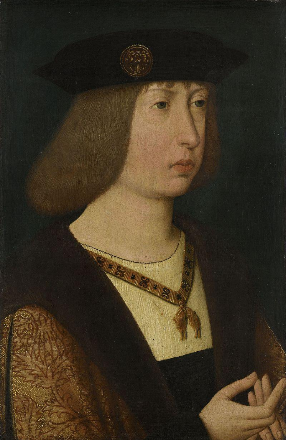
Филипп Красивый (1478-1506)