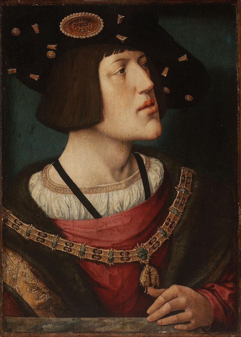
Карл V (Б. Орлей, 1519)