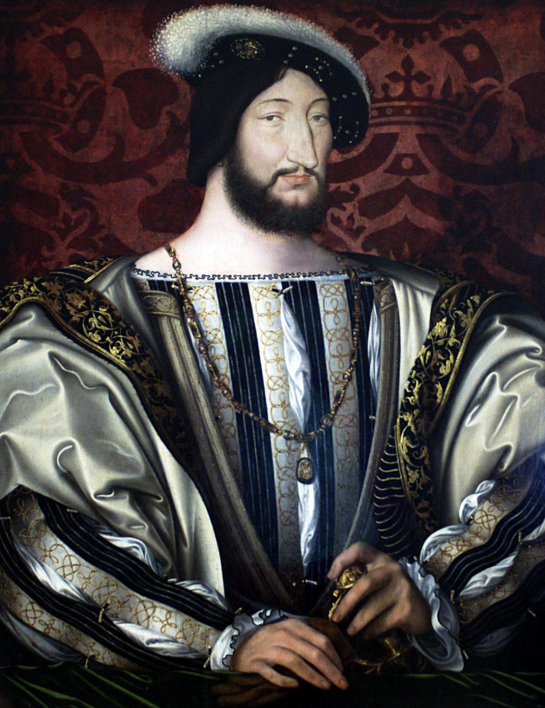
Портрет Франциска I, Ж. Клуэ, 1525