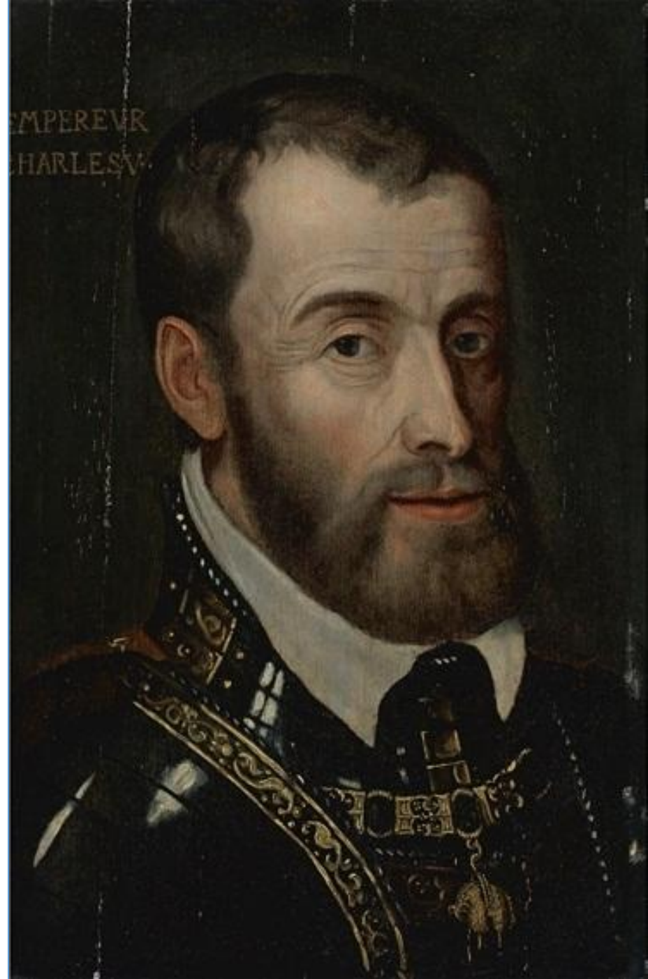
Карл V (Тициан, 1548)