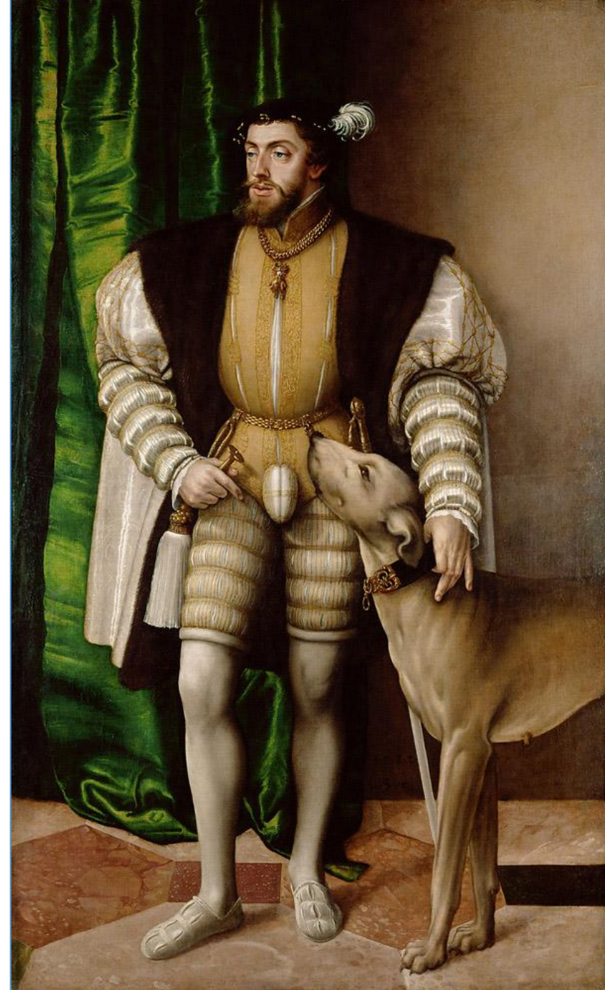
Портрет Карла V, Тициан, 1533