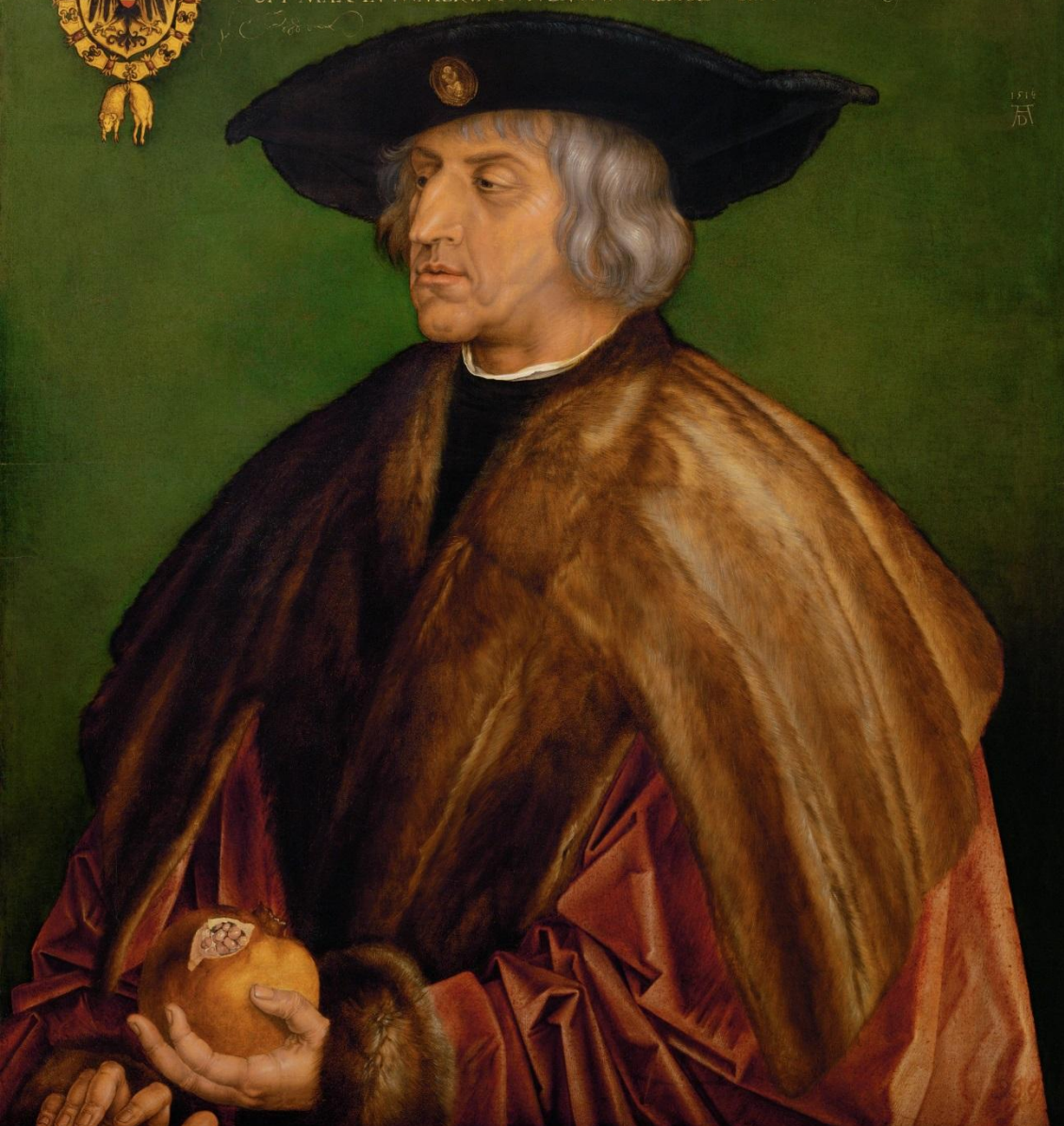
Максимиллиан I (1508-1519) (А. Дюрер, 1519)

POTENTISSIMVS MAXIMVS ET INVICTISSIMVS CÆSAR MAXIMILIANVS QVI CUNCTOS SVI TEMPORIS REGES ET PRINCIPES IVSTICIA PRVDENCIA MAGNANIMITATE LIBERALITATE PRECIPVE VERO BELLICA LAVDE ET ANIMI FORTITVDINE SVPERAVIT NATVS EST ANNO SALVTIS HVMANÆ M·CCCC·LIX·DIE·MARCHII·IX·VIXIT·ANNOS·LIX·MENSES·IX·DIES·XXV DECESSIT·VERO·ANNO·M·D·XIX·MENSIS·IANVARIII·DIE·XII·QVEM·DEVS OPT·MAX·IN·NVMERVM·VIVENCIVM·REFRRE·VELIT·