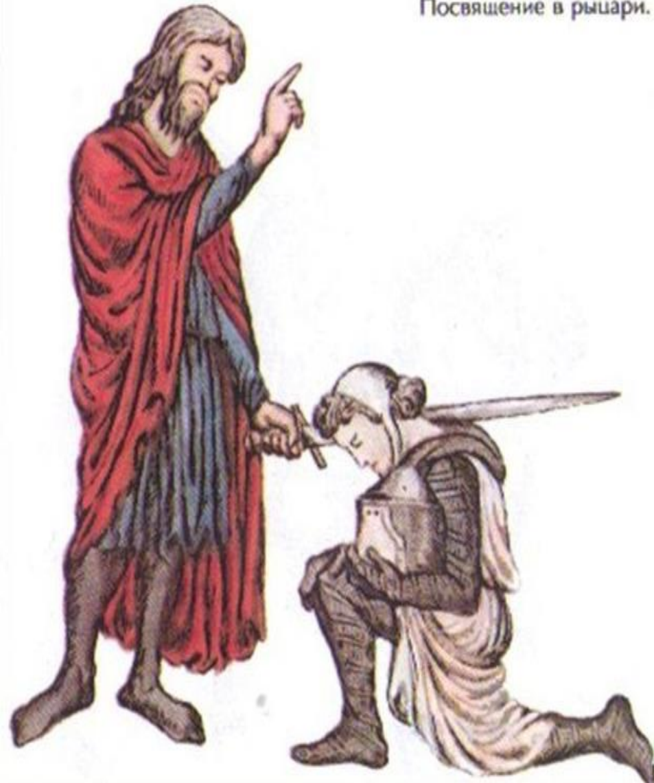
Посвящение в рыцари.

Учитель предлагает побеседовать на тему рыцарства. Дополняет и поправляет учеников; рассказывает о нормах и обычаях средневекового рыцарства.