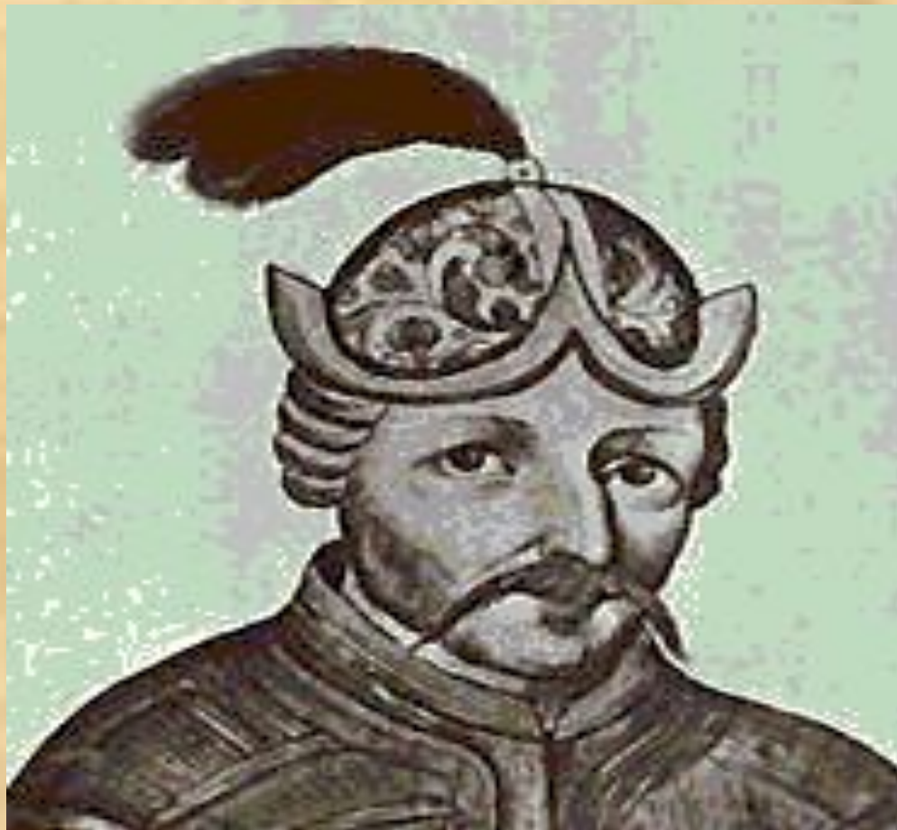
Великий князь Рюрик

Три князя варяго-русские Рюрик и два его брата пришли к нам и начали княжить: сам Рюрик сел в Новгороде, а братьев послал в другие города. Так началось в 862 году (IX век) Русское государство. От имени рода первых князей оно и назвалось Русью.