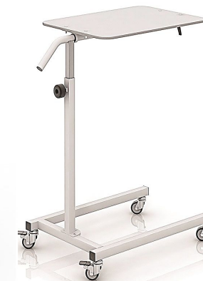
ТУМБОЧКИ И СТОЛЫ ПРИКРОВАТНЫЕ