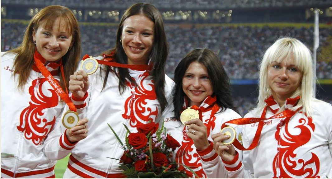
Олимпийские игры в Пекине в 2008 году

Это не первый город, в котором Олимпийские игры проводились более одного раза, но они первыми проводят летние (2008 г.) и зимние (2022 г.) Олимпийские игры.