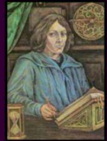
польский ученый Николай Коперник (1473—1543)