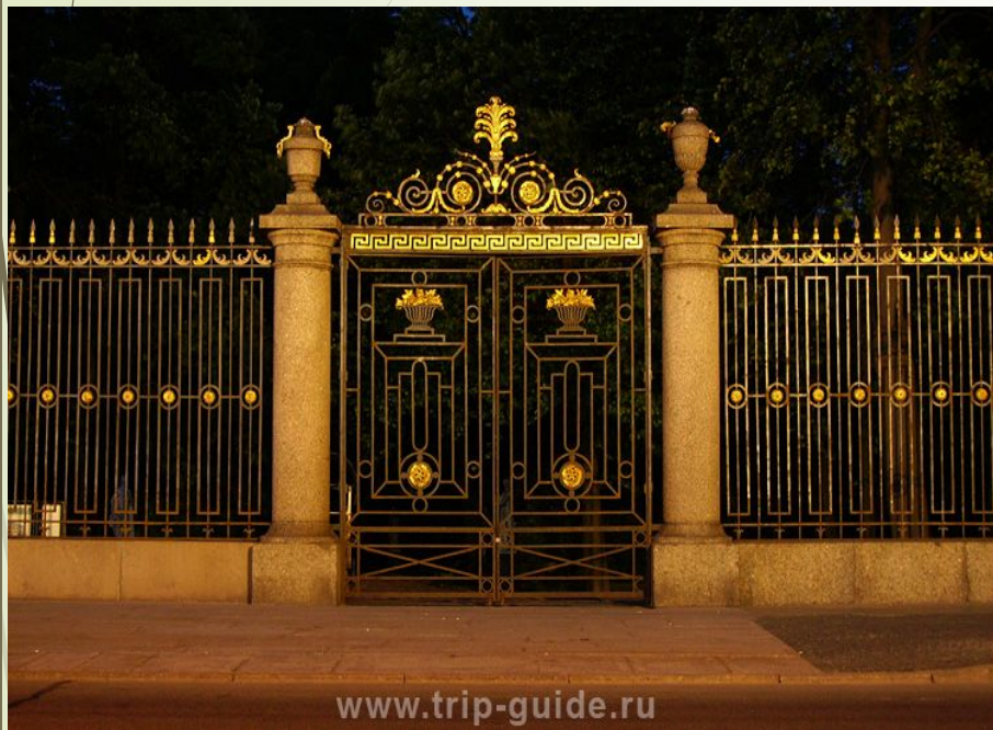
Решётка Летнего сада