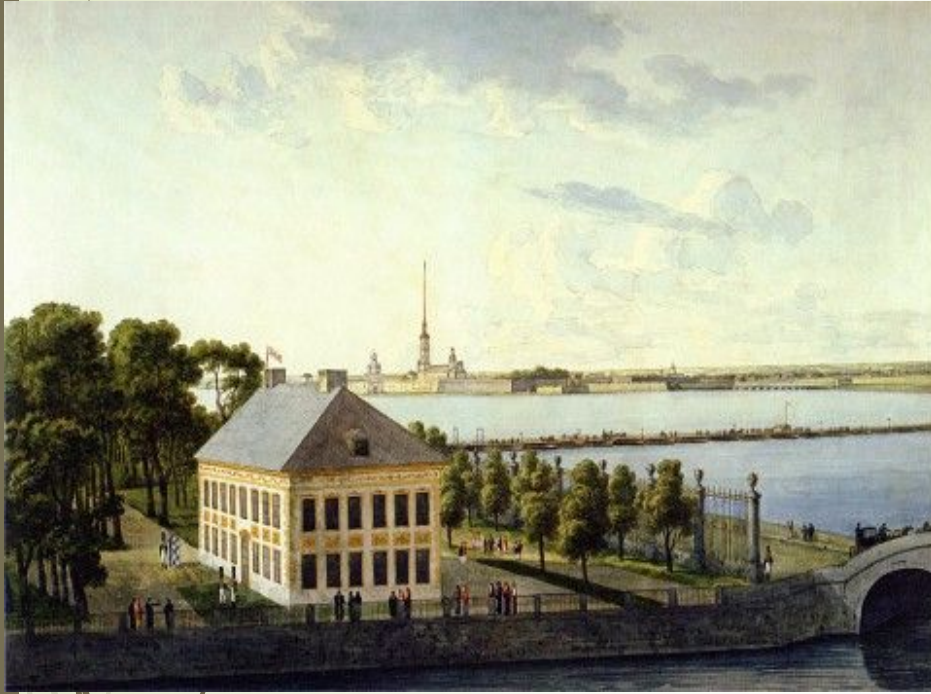
Летний дворец Петра Первого