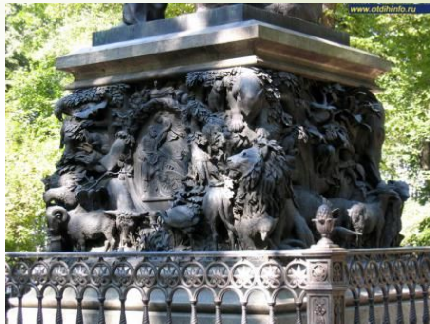
Барельеф памятника И. А. Крылову