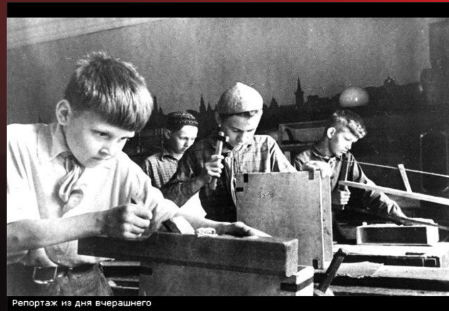
Репортаж из дня вчерашнего