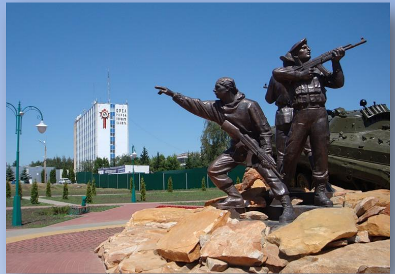
Памятник участникам военных конфликтов и локальных войн. г. Орел