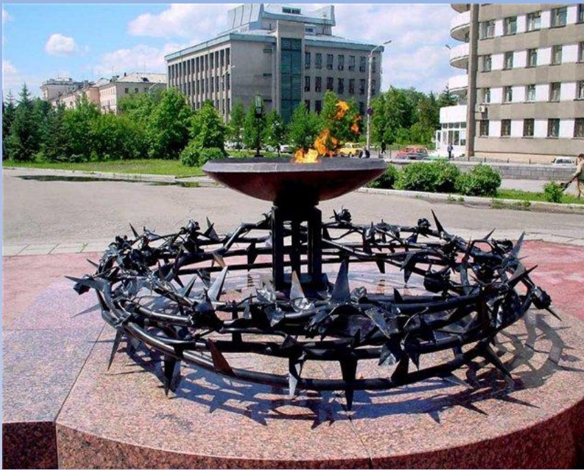
Мемориал памяти воинов, погибших в Афганистане. БАРНАУЛ