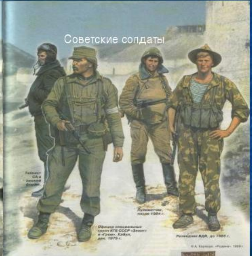
Танкист СА и лыжный батальон.