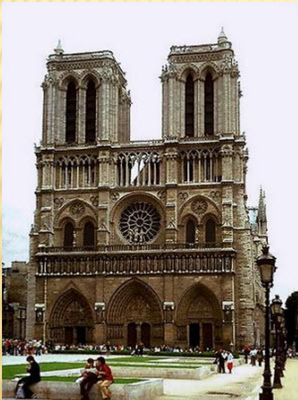
Собор Нотр-Дам де Пари

Церковь – это храм Божий. Храмы, соборы, церкви и часовни являются не только священным местом для верующих людей, но и прекрасными произведениями искусств во славу Господа.