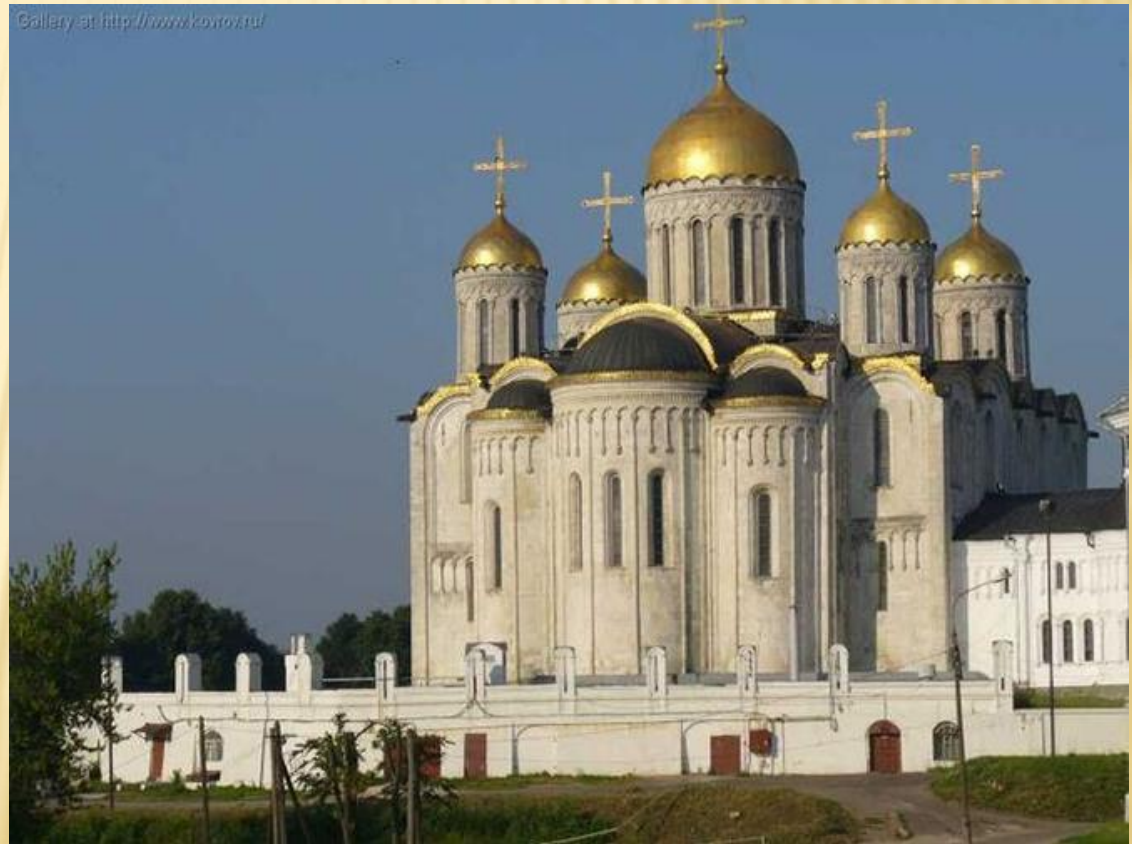
Успенский собор во Владимире