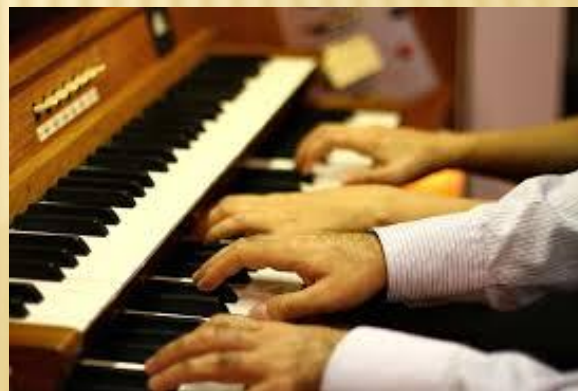
Орган католического храма