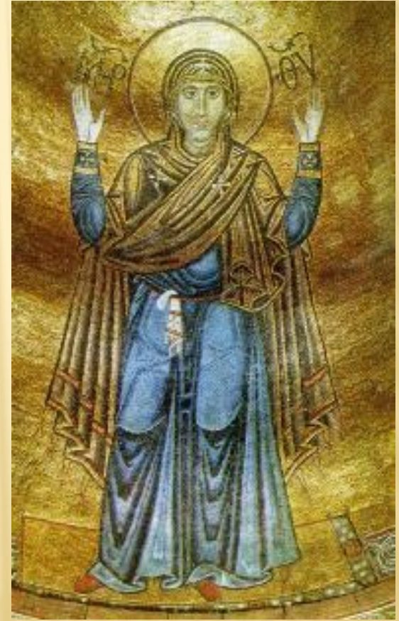
Мозаика Богородицы Оранта Софии Киевской