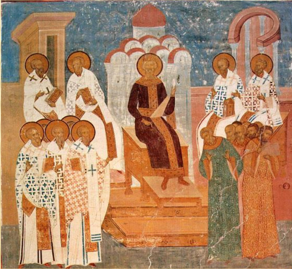
Фреска Дионисия собора Рождества Богородицы

В монументальных образах фресок и мозаик предстают пред нами божественные лики СВЯТЫХ .