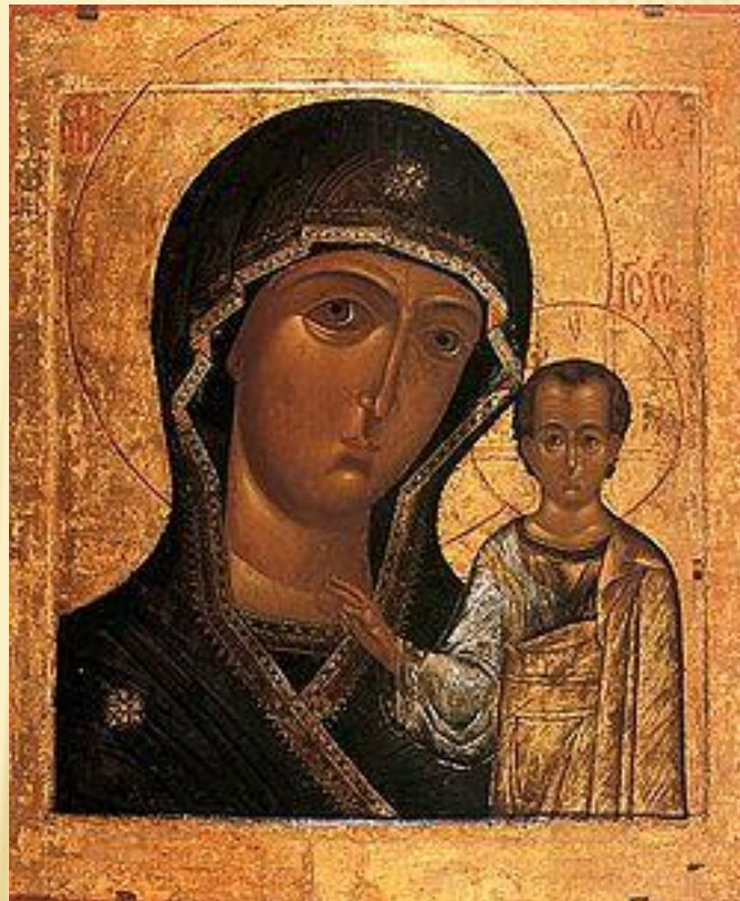
Казанская икона Пресвятой Божией Матери

Для православного христианина икона — это способ приобщения к тайне, средство получения благодати, способной оказывать влияние на человека, чудесным образом решать его проблемы и даже воздействовать на ход событий. Не случайно в России пользуются широкой славой иконы — заступницы, защитницы, целительницы.