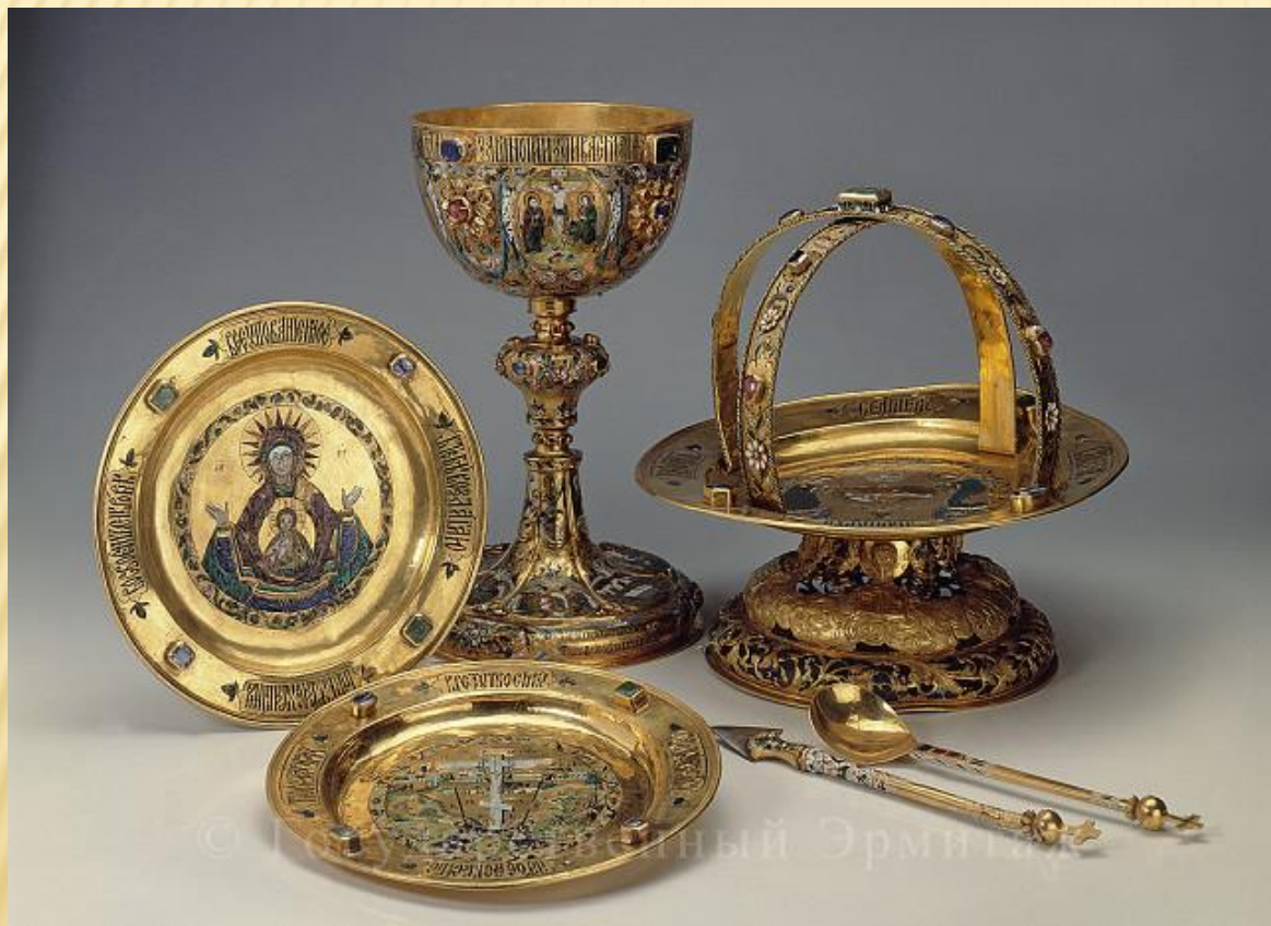
Атрибуты для причастия

Внутреннее убранство храма, богослужение гармонично дополняются произведениями декоративно-прикладного искусства.