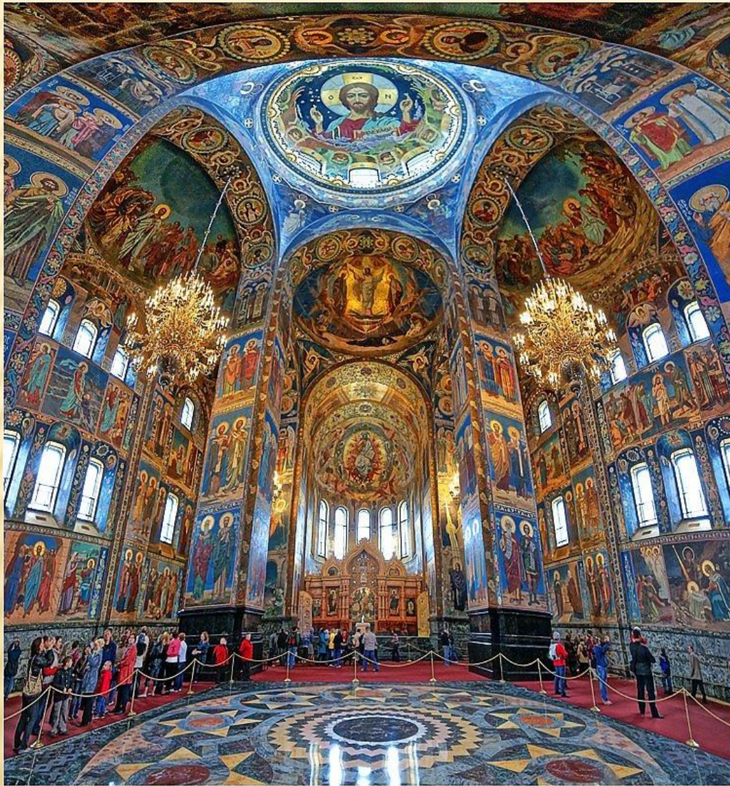
Собор Василия Блаженного в Москве