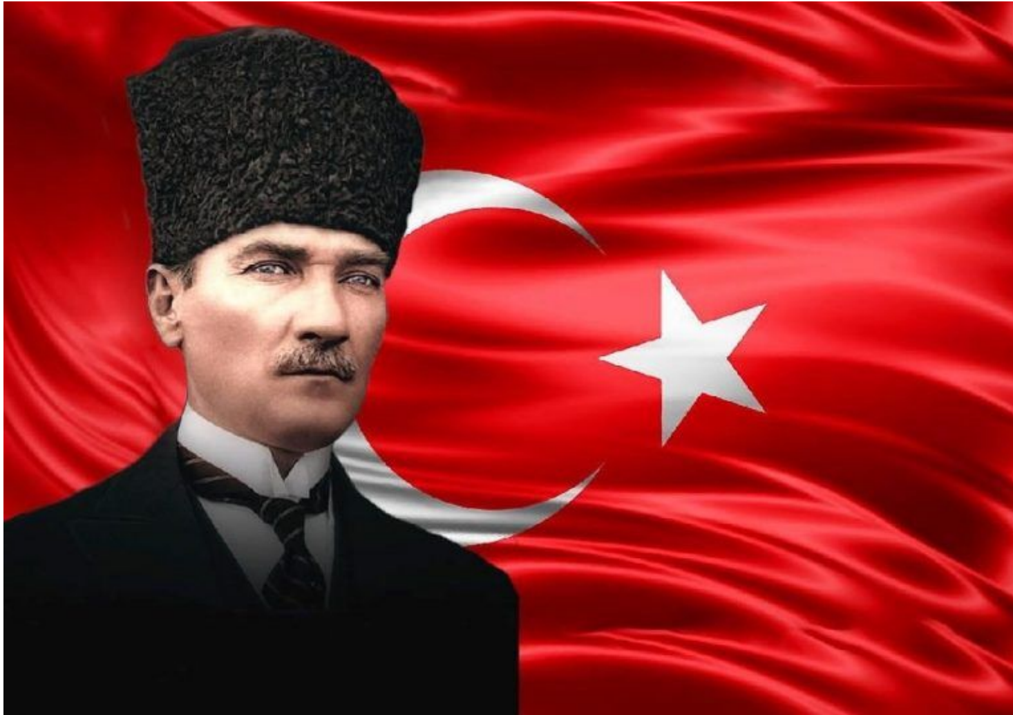
Мустафа Кемаль - первый президент Турецкой Республики

В 20-х годах XX века была провозглашена Турецкая Республика.