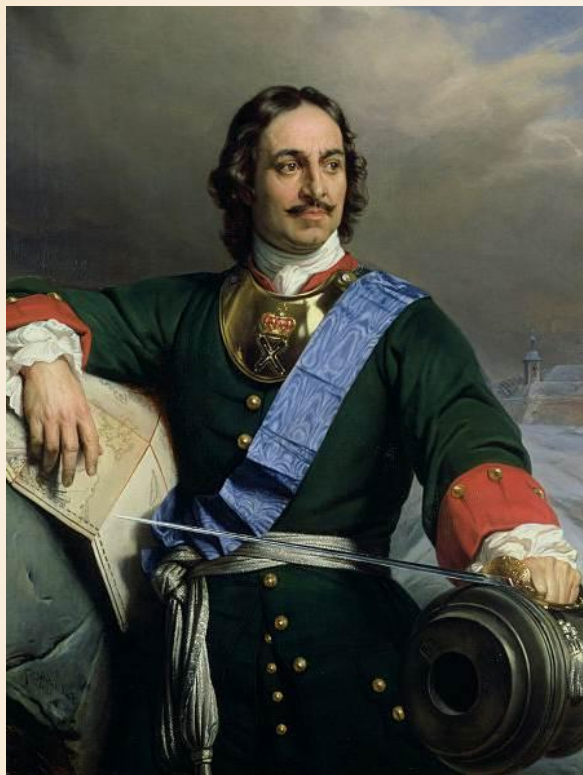
Пётр I 1672–1725

Время правления Петра I было не только временем реформ , но и временем частых и мощных выступлений народа в борьбе за улучшение своего положения.