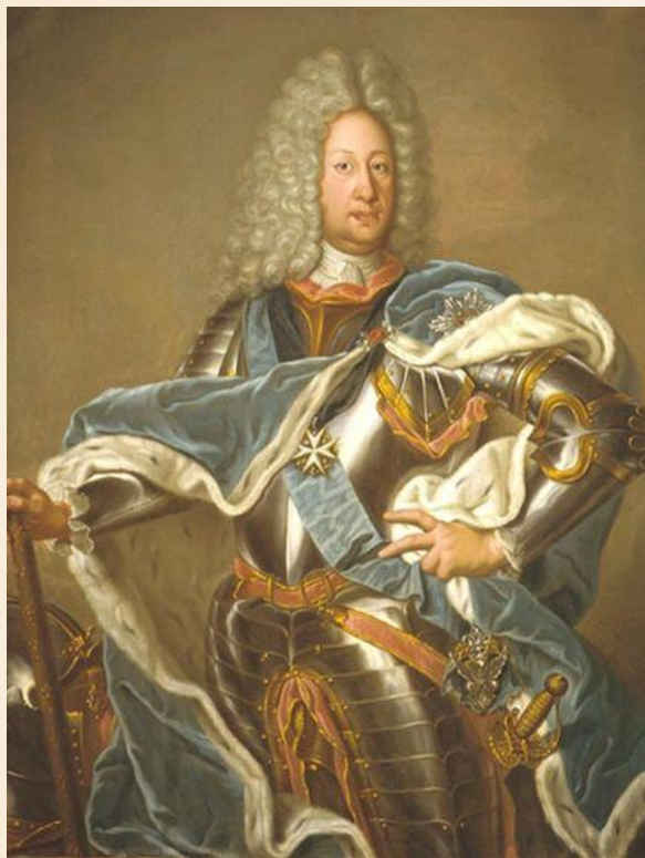
Борис Петрович Шереметев