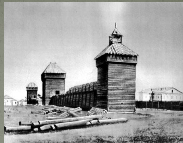
Последние остатки крепости. фото начала XX в.

Из “отписки” Петра Бекетова царю Михаилу Федоровичу.