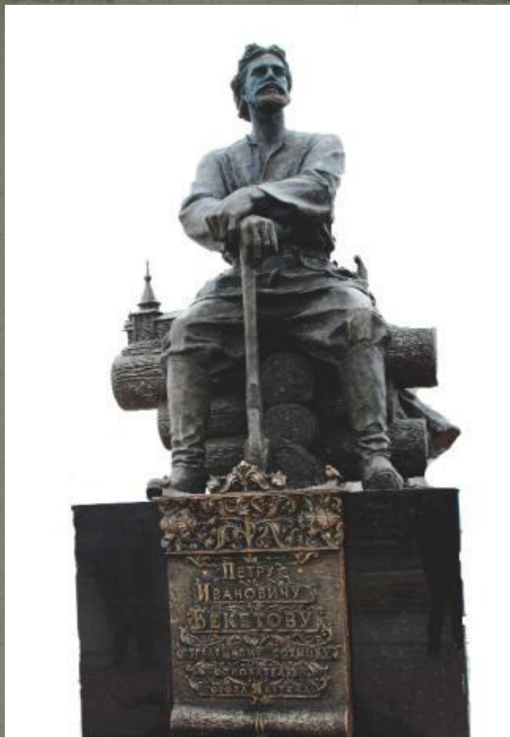
Основатель Якутска – Петр Бекетов