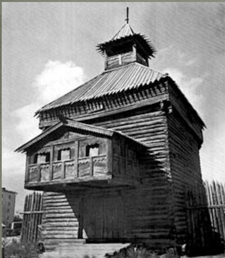
Башня якутского острога. Фотография 1983г.