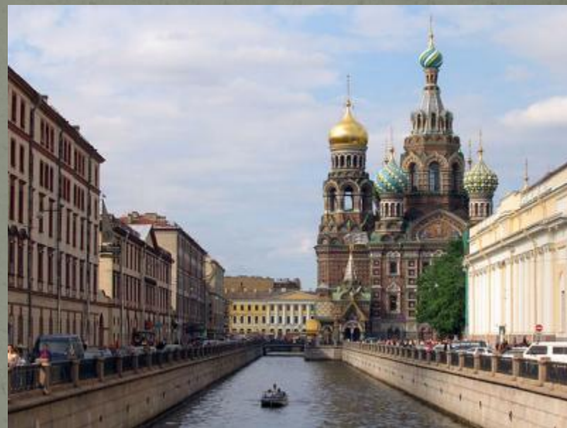
Санкт-Петербург Спас на крови