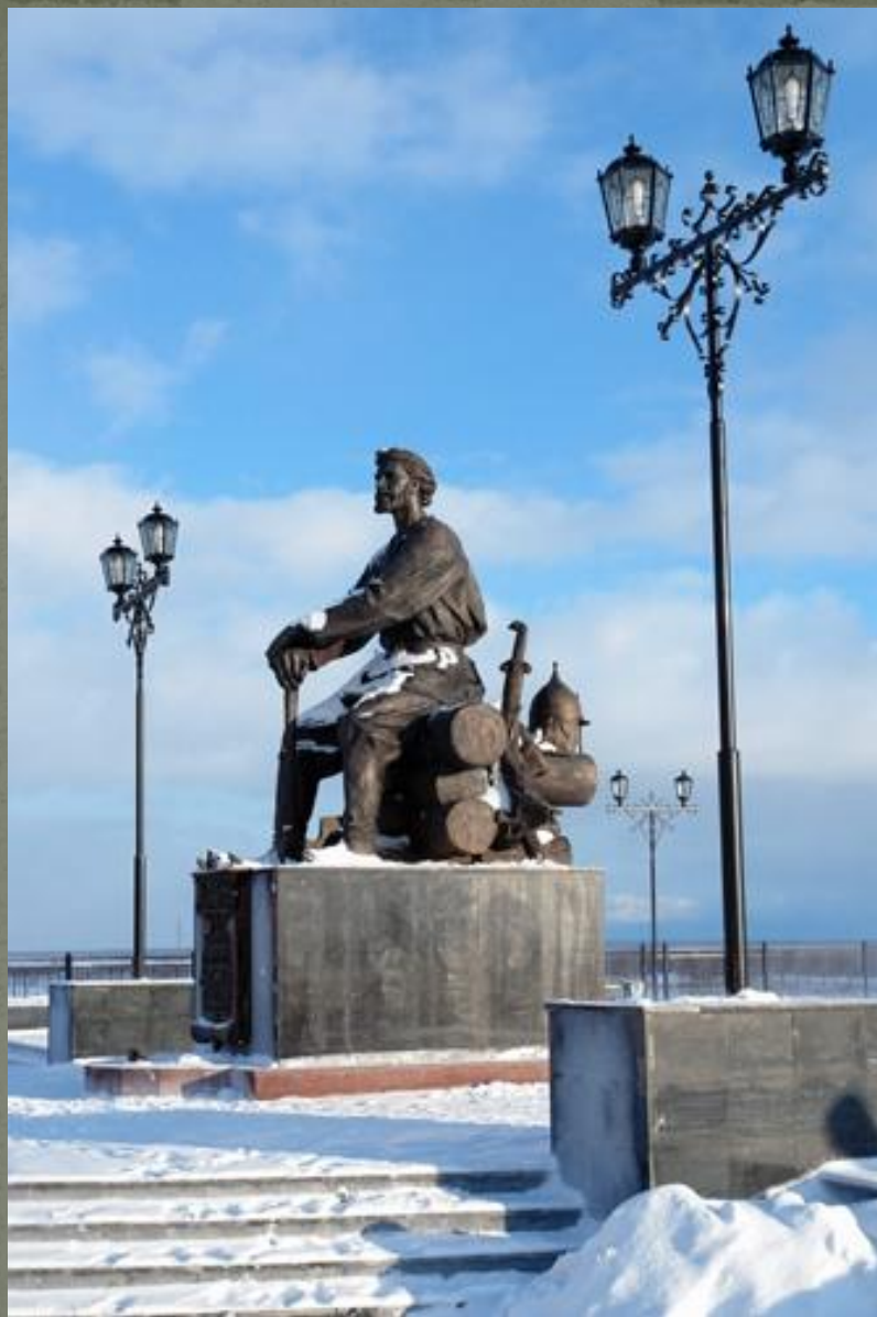
Памятник П. Бекетову в Якутске