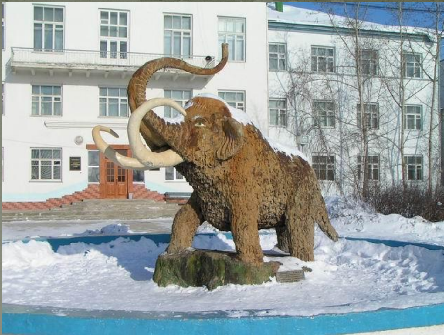
В Якутске установлен памятник мамонту перед зданием Институт мерзлотоведения им. акад. П. И. Мельникова