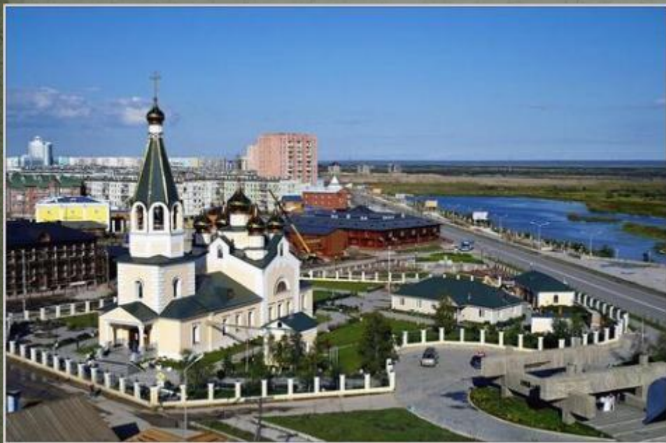
Якутск. Вид на Старый город

Если прислониться щекой к стенам старых городских зданий, то они с удовольствием поведают историю нашего города, города, который на 71 год старше Санкт-Петербурга! Захватывает дух от мысли о том, что в то время, когда на месте Санкт-Петербурга были болота, шумели леса и бродили дикие животные, здесь на берегу Лены, уже стучали топоры якутских градостроителей, поднимались высокие крепостные стены и башни, и звучали голоса первых городских жителей!