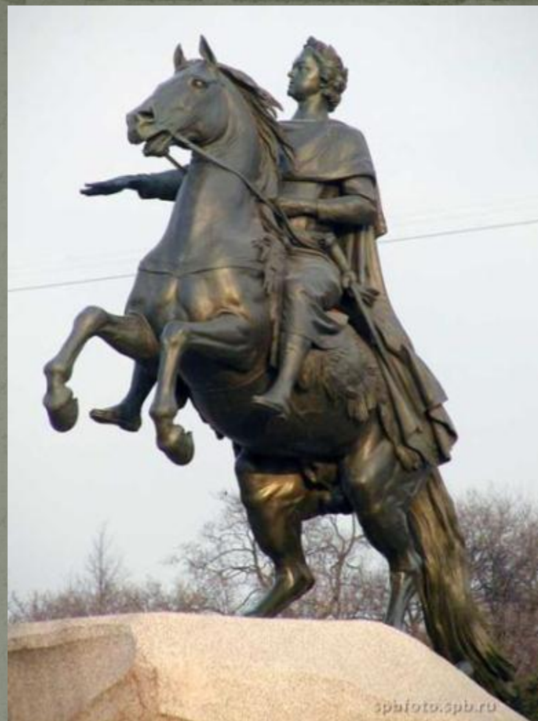
Основатель Санкт-Петербурга – Петр Великий