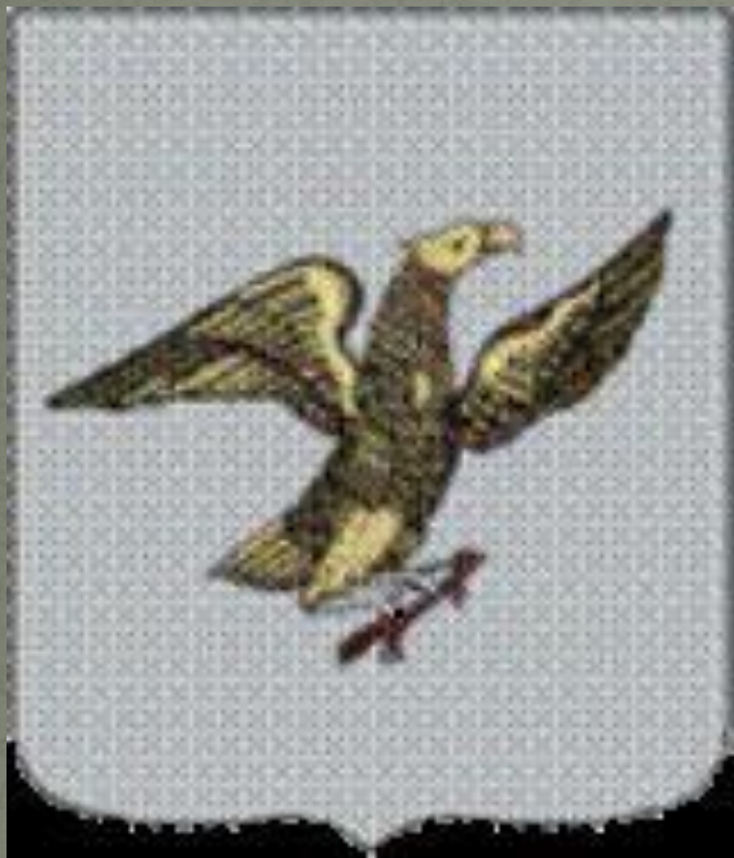
Первый герб Якутска

Первый герб Якутска был утвержден 26 октября 1790 года. Описание герба было следующим: "В серебряном поле орел, держащий в когтях соболя". Данный герб был создан по прототипу печати Якутского острога, известной с 17 века. Описание якутской эмблемы, закрепившейся позднее на гербе города, есть и в "Росписи Сибирским печатям 1692 года". В ней сказано: "На великой реке Лене в Якутском остроге печать государева - орел поймал соболя".