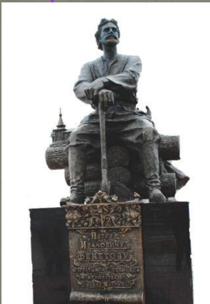
Памятник П. Бекетову в Якутске

Пётр Иванович Бекетов (около 1600 года —1655—1656) — русский путешественник, воевода, исследователь Сибири, основатель некоторых сибирских городов, таких как Якутск, Чита, Нерчинск. Весной 1632 года отряд Бекетова прибыл на Лену. Недалеко от впадения в неё реки Алдан бекетовские казаки срубили небольшую крепость. Этот острог сыграл непреходящую роль во всех дальнейших открытиях, стал для России окном на Дальний Восток и Аляску, в Японию и Китай. Деятельность Петра Бекетова в Якутии на этом не заканчивается.