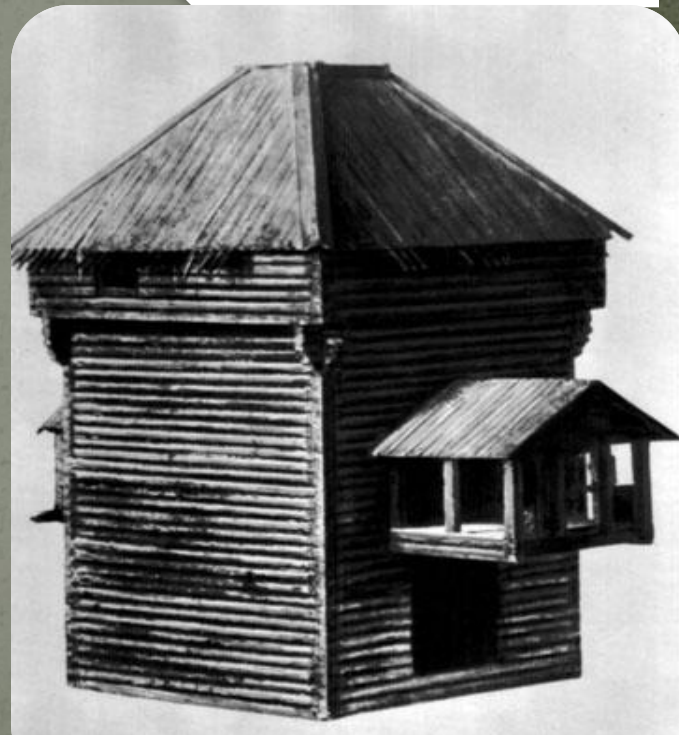
Башни-крепости во второй половине XIX в. По материалам Археологической комиссии