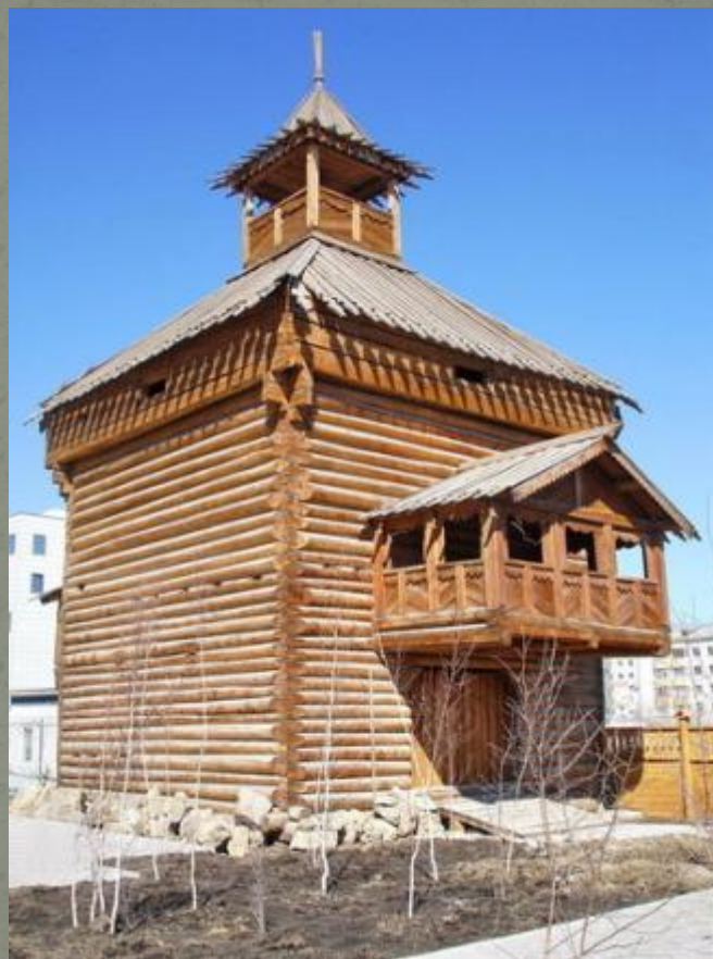
Реконструкция башни якутского острога