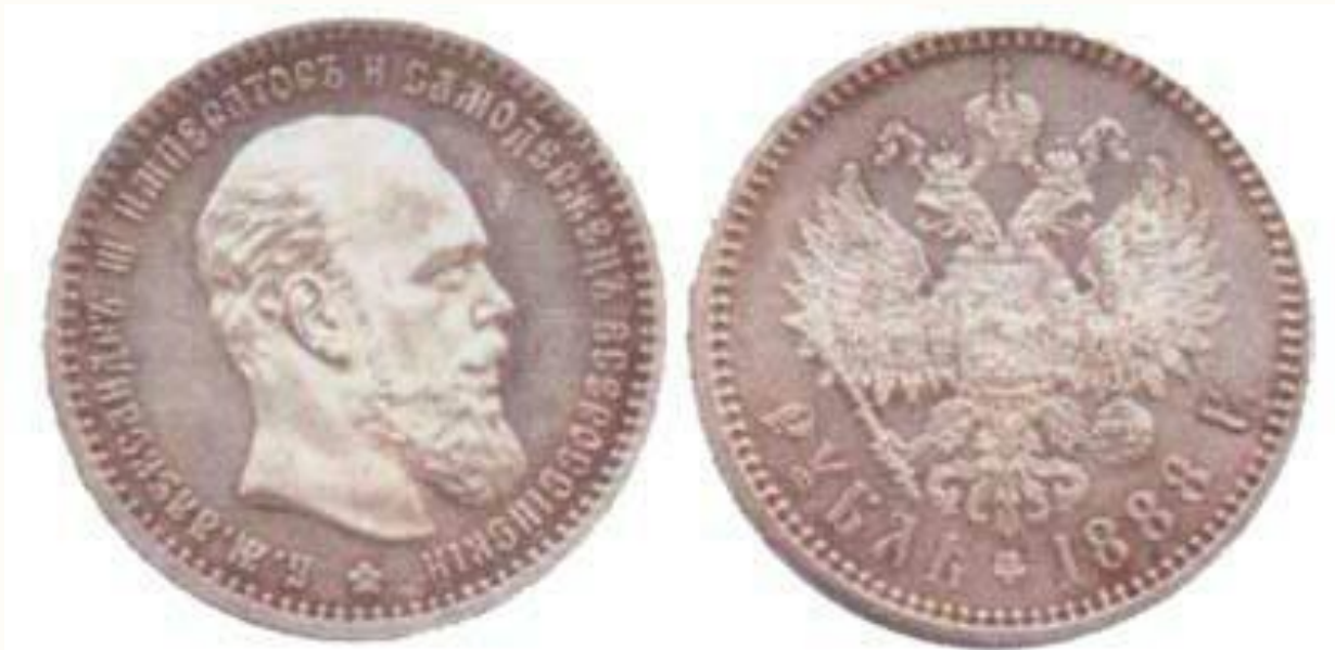
Серебряный рубль Александра III