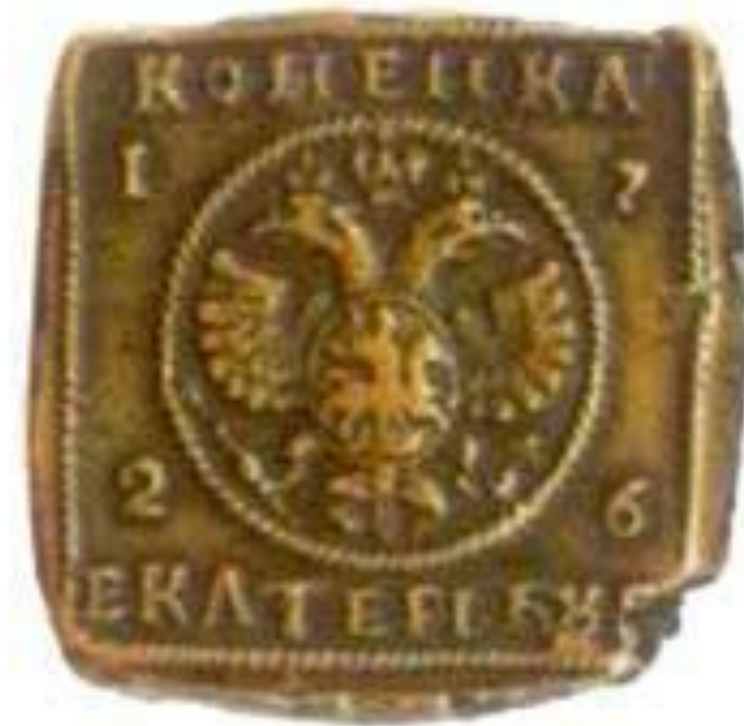
Копейка Екатерины I