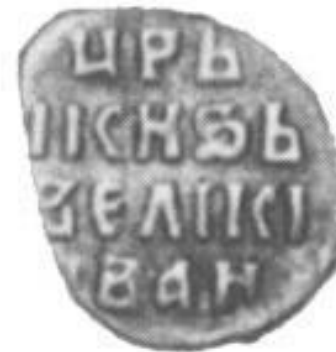
Копейка Ивана Грозного.