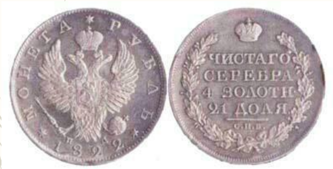
Серебряный рубль Александра I