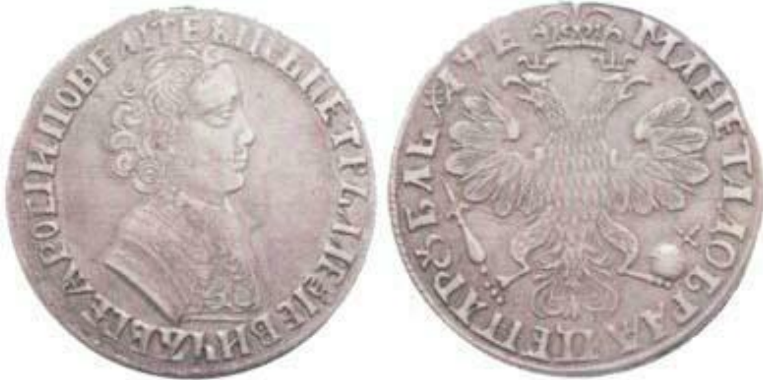
Монета Петра I