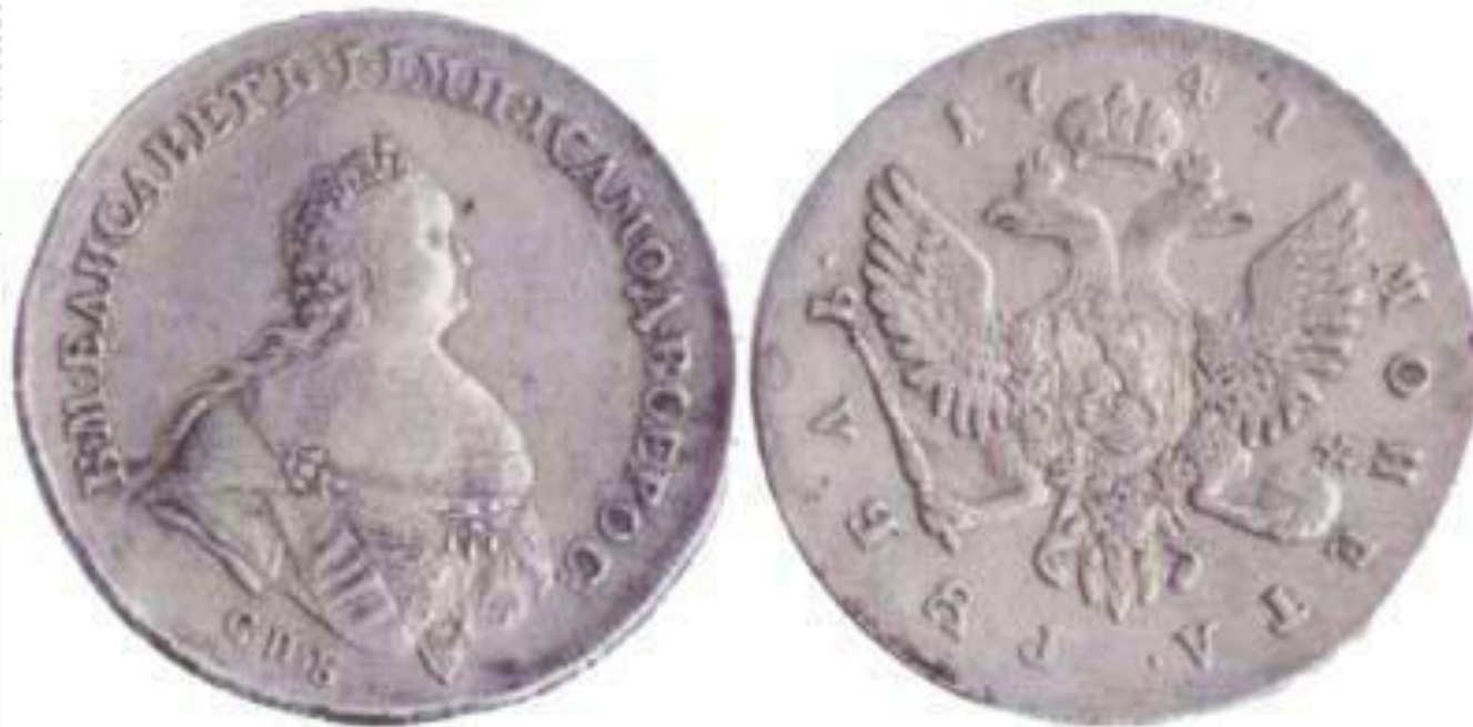
Серебряный рубль Елизаветы Петровны