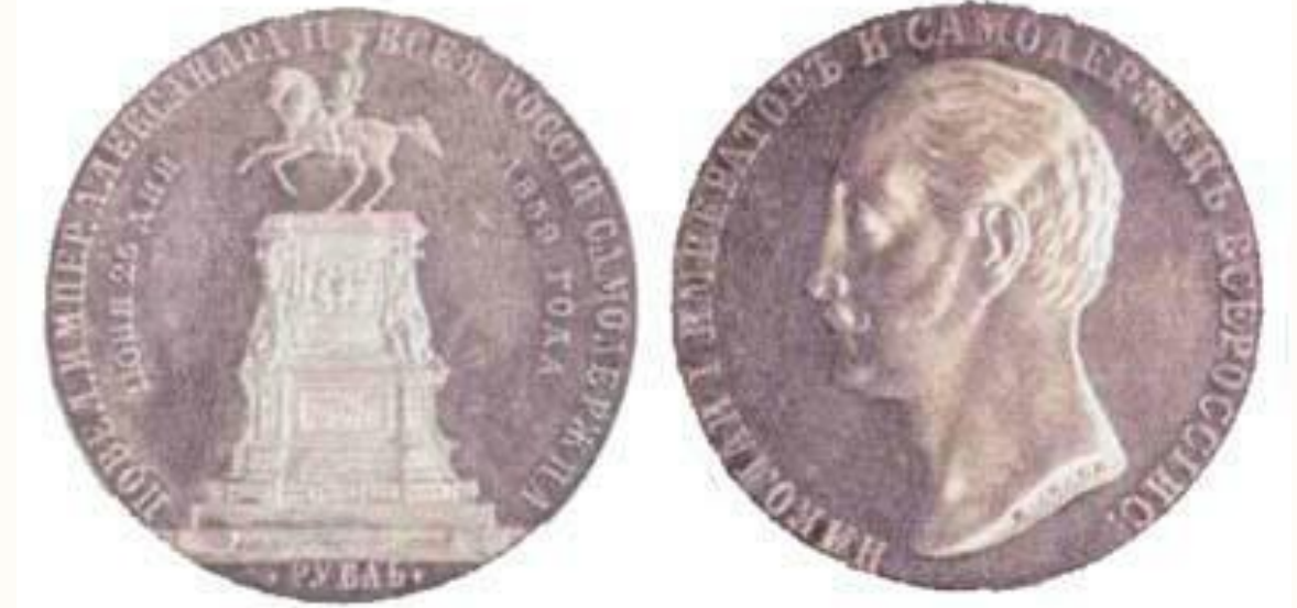
Серебряный рубль 1859г. Открытие памятника Николаю I