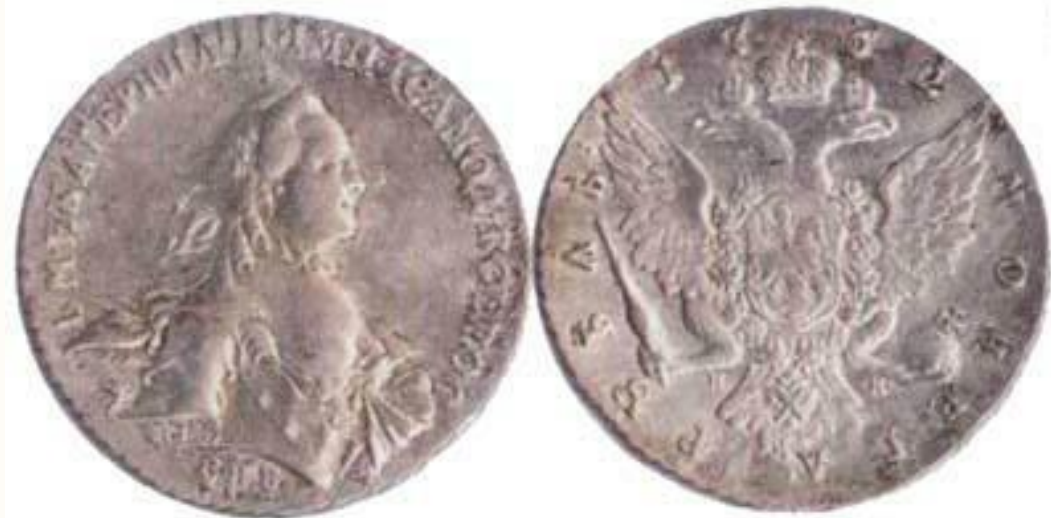
Серебряный рубль Екатерины II