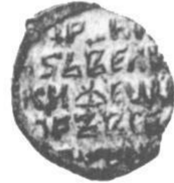
Монета Федора Иоановича.