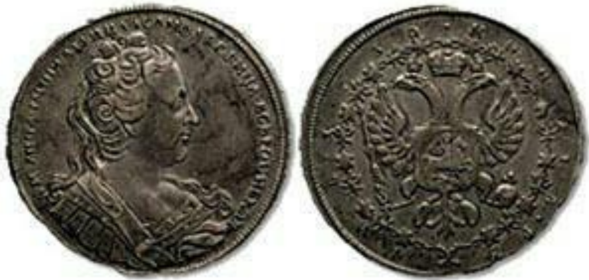
Серебряный рубль Анны Иоановны