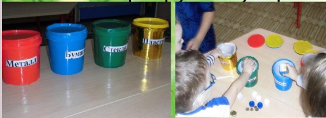
Дидактическая игра «Сортируем мусор»