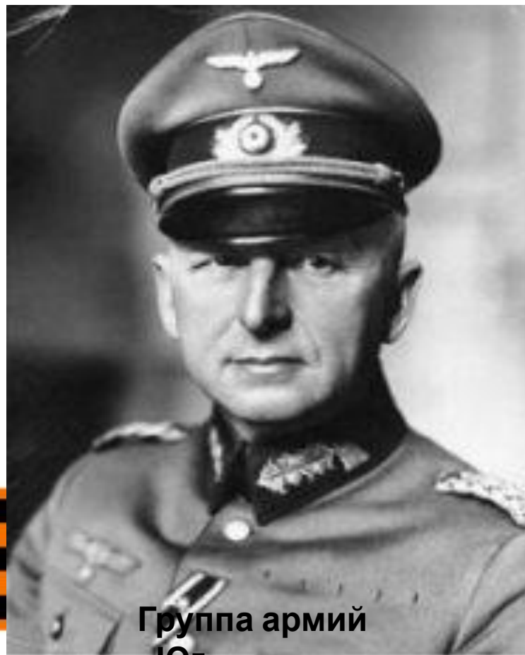
Группа армий «Юг»