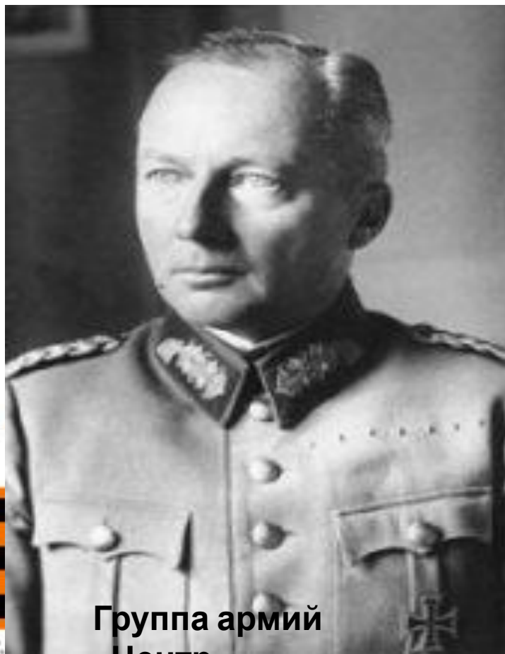
Группа армий «Центр»

Немецкая операция «Цитадель» контролировалась двумя талантливейшими генералами- фельдмаршалом фон Клюге и генералом Эрихом фон Манштейном.