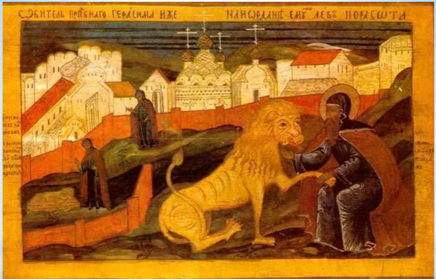
Преподобный Герасим Иорданский приручает льва