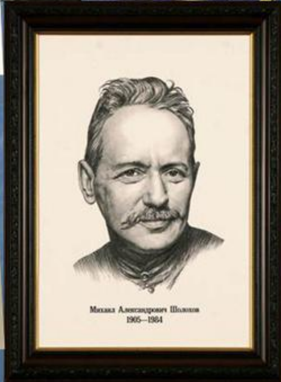
Михаил Александрович Шолохов 1905—1984