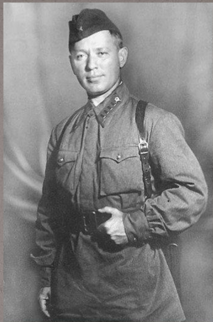
Перед отправкой на фронт

Судьба воюющего народа становится и его судьбой. Шолохов сражался как писатель, на страницах газет стали появляться его статьи и очерки.