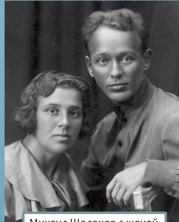
Михаил Шолохов с женой Марией