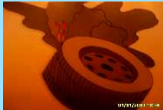
Запах горячей резины