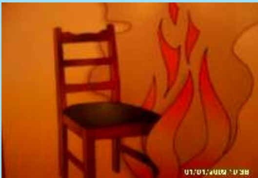
Потрескивание горящих предметов