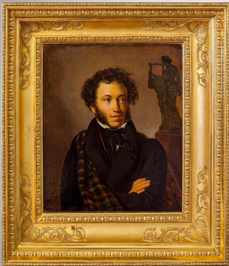
Александр Сергеевич Пушкин.