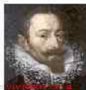
Максимиллиан I Баварский