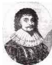
Фридрих V Пфальцский