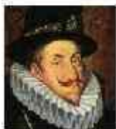
Фердинанд II (император)