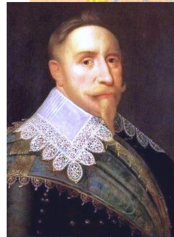
Густав II Адольф