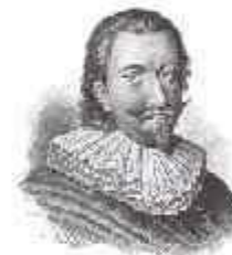
Кристиан IV Датский