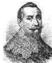
Густав Адольф II (король Швеции)