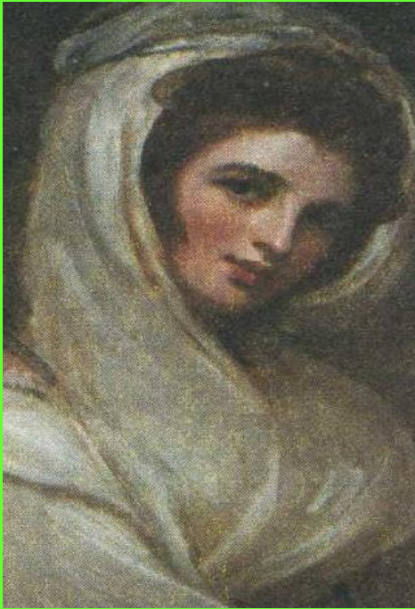
Джордж Ромни. Портрет леди Гамильтон. Фрагмент. Ок. 1785 г.