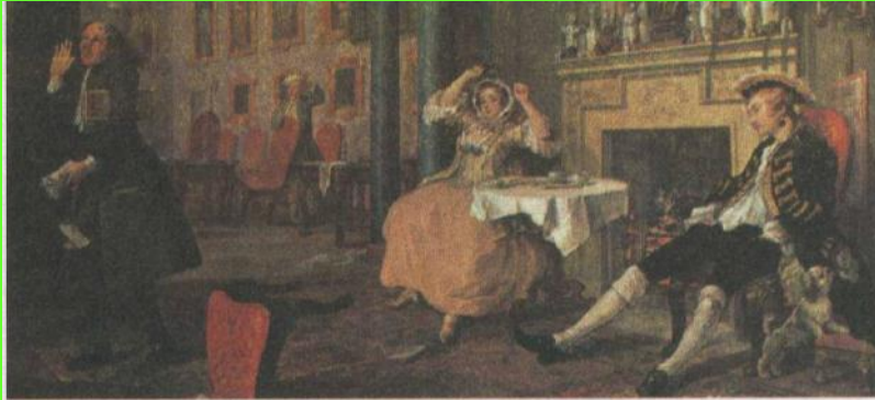
У. Хогарт. Вскоре после свадьбы. Фрагмент. 1743 г. Картина из серии «Модный брак»