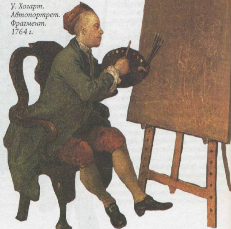
У. Хогарт. Автопортрет. Фрагмент. 1764 г.

Выдающимся художником Англии XVIII в. был У. Хогарт. Он прославился своими сатирическими гравюрами, в которых показывал продажность парламента и суда, обнищание народа, лживость и лицемерие богатей. Гравюры Хогарта продавались нарасхват: они были дешевыми и доступными для всех слоев общества. Хогарт создавал гравюры и картины сериями, прослеживая в них «комедию жизни». «Модный брак» в 6 картинах рассказывает о безнравственности и крахе брака по расчету между разорившимся аристократом и богатой невестой из буржуазной семьи. Хогарт много и плодотворно работал в жанре портрета. Лучшие его портреты «Слуги Хогарта» и «Девушка с креветками». В них автору удалось глубоко раскрыть характеры своих персонажей. Кажется, прямо с шумной улицы Лондона художник перенес на полотно удивительно живой образ продавщицы креветок.