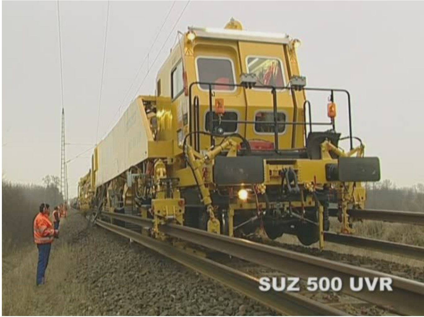
SUZ 500 UVR