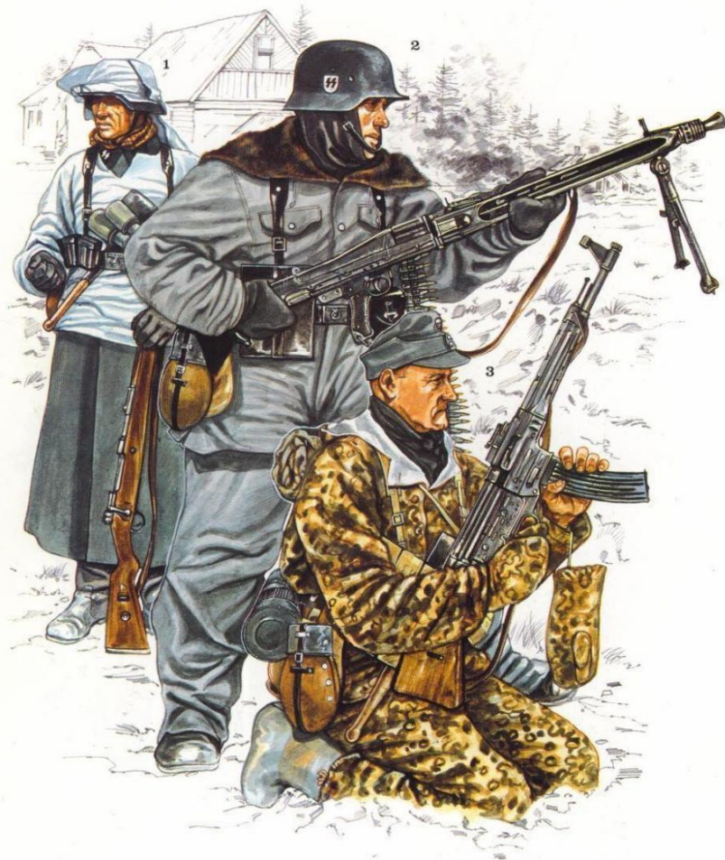
Russia, winter, 1941-45: 1. SS-Mann, infantry, SS-Div. 'Reich', 1941-42 2. SS-Schütze, infantry, Kharkov, 1943 3. SS-Schütze, infantry, 1944-45