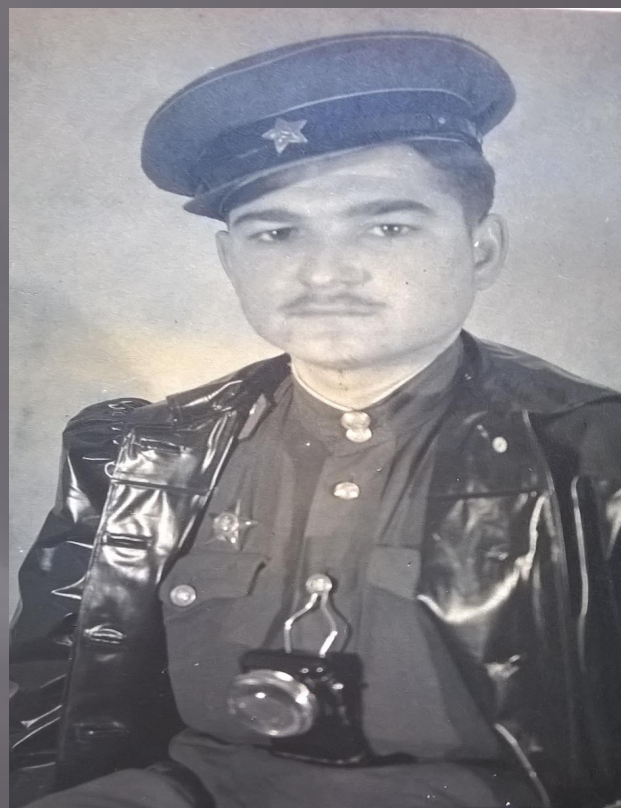
Май 1946 год. Германия.