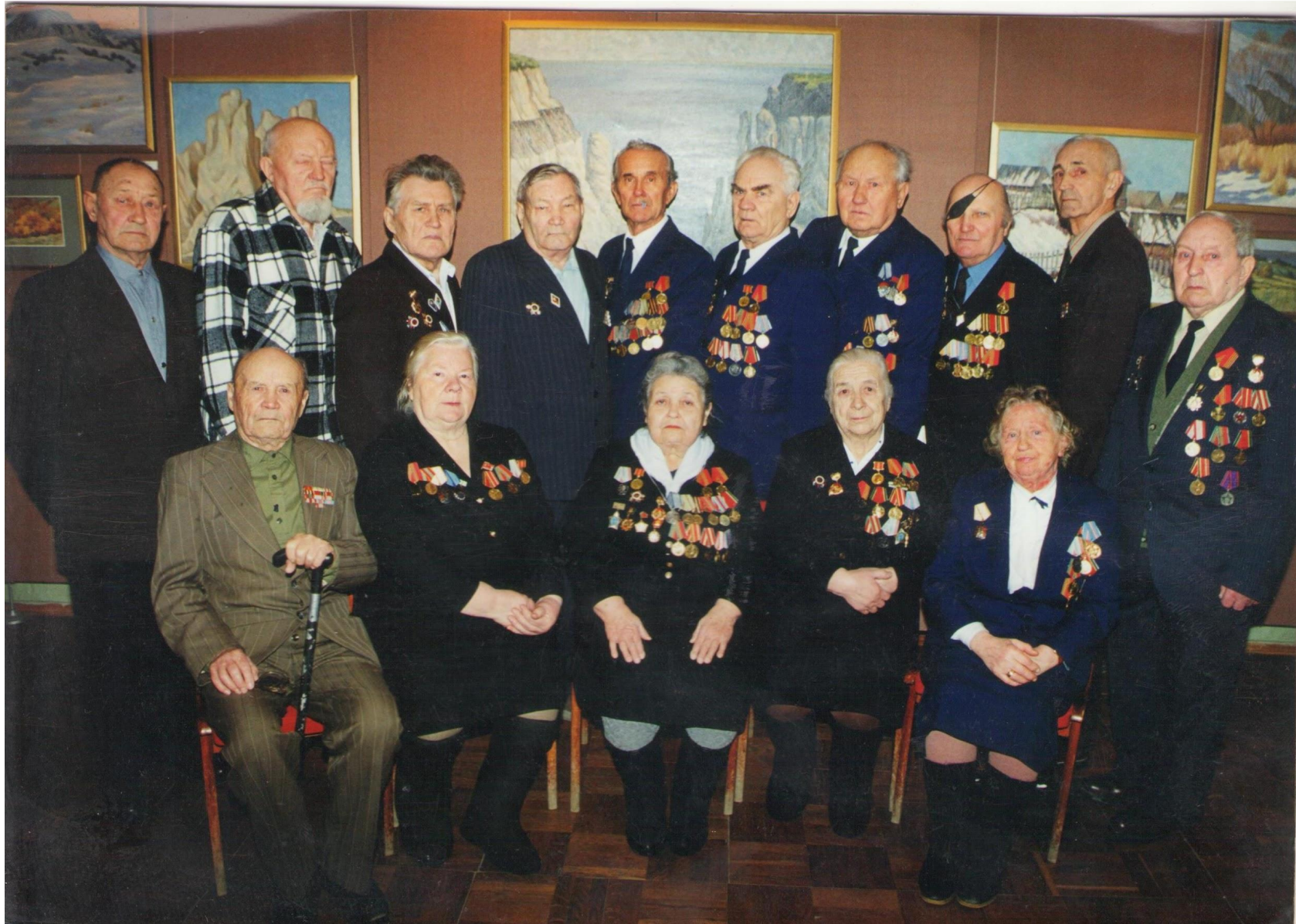
Наши земляки – участники Сталинградской битвы