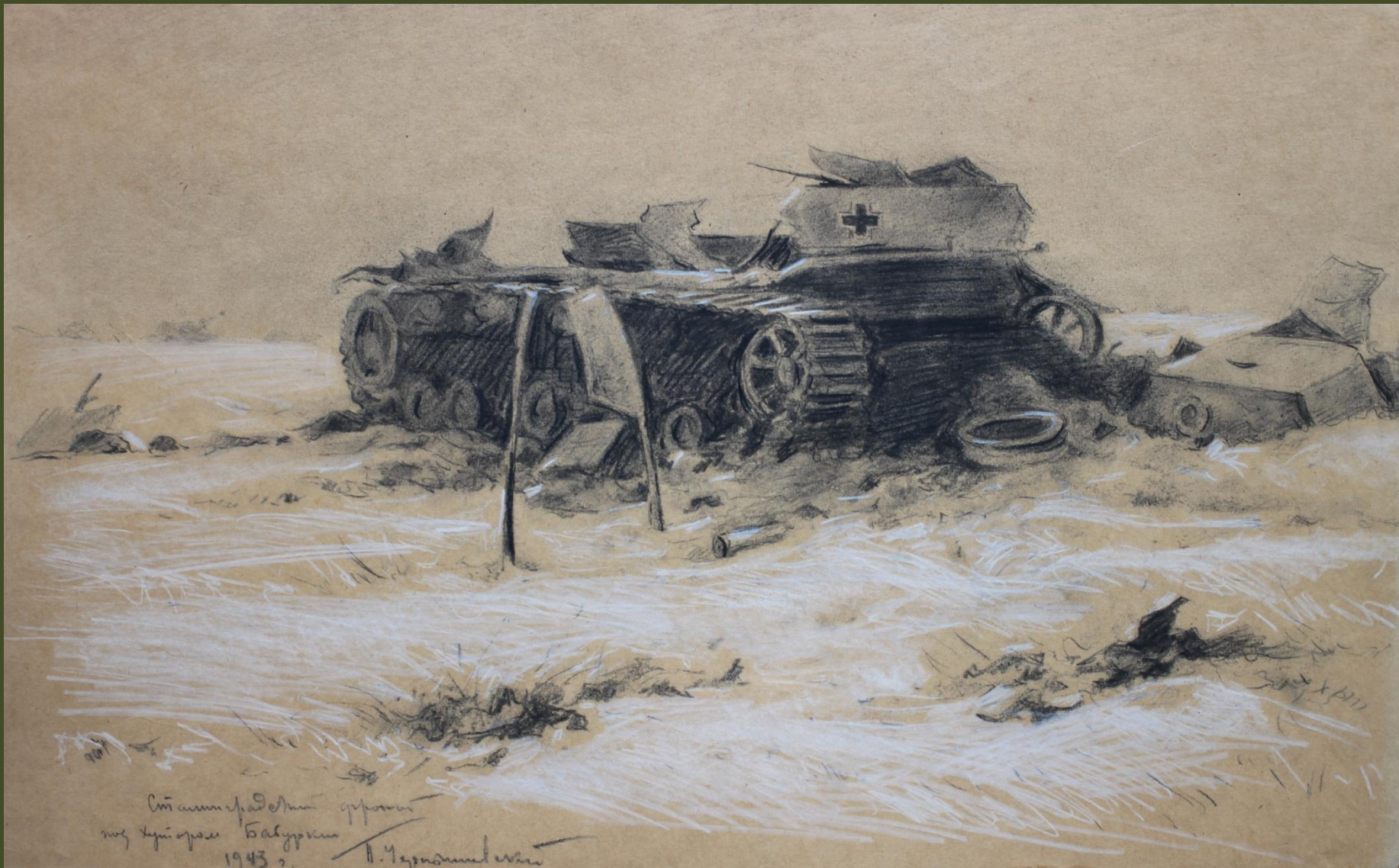
П.А. Чернышевский. Сталинградский фронт. Под хутором Бабурки. 1943 г.