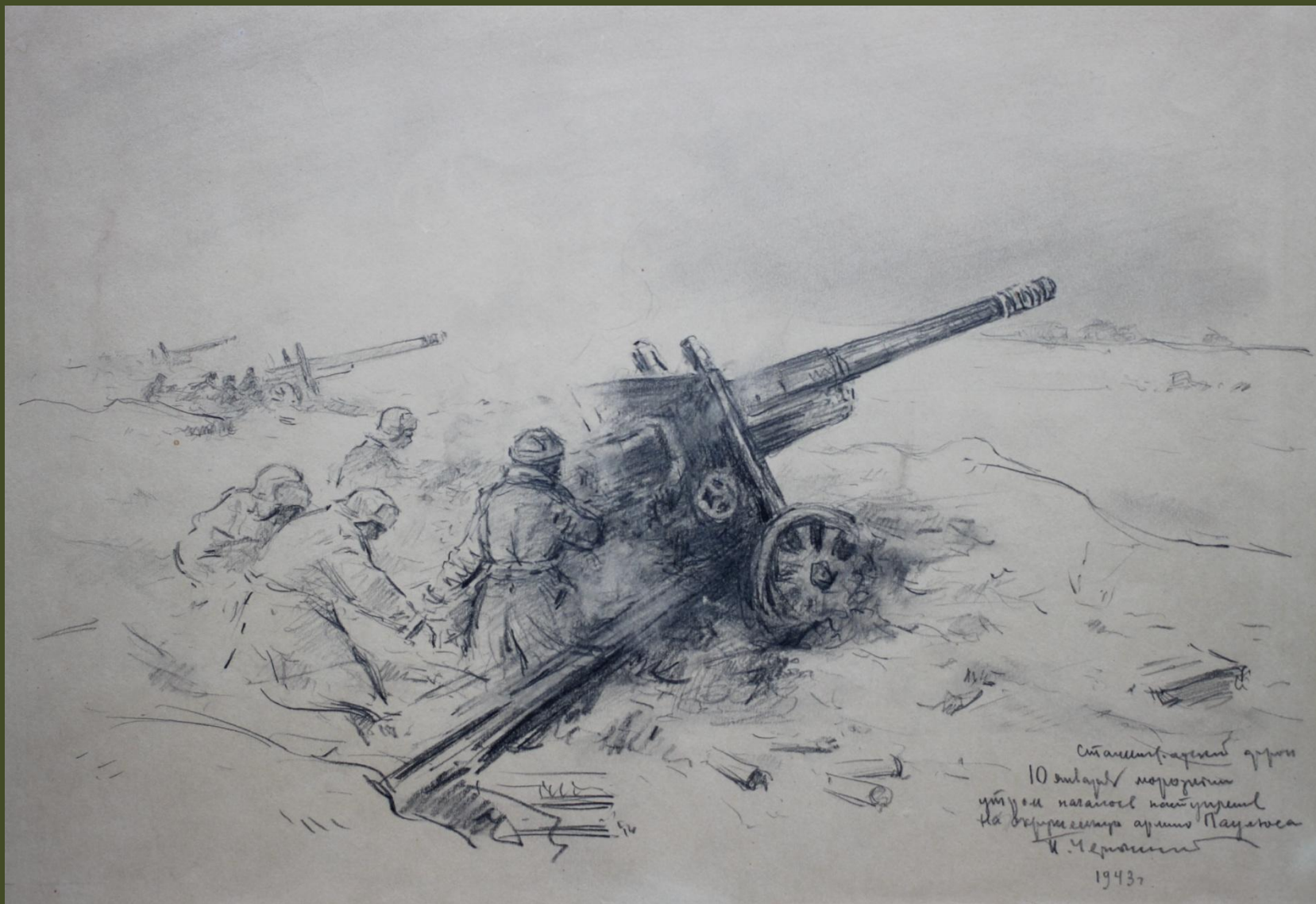
П.А. Чернышевский. Сталинградский фронт. 10 января морозным утром началось наступление на окруженную армию Паулюса. 1943 г.