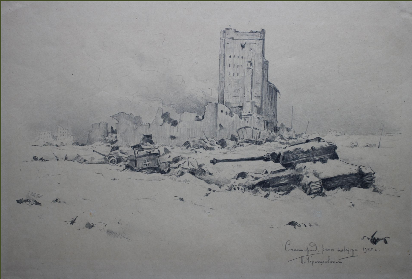
П.А. Чернышевский. Сталинград. Район элеватора. 1942 г.