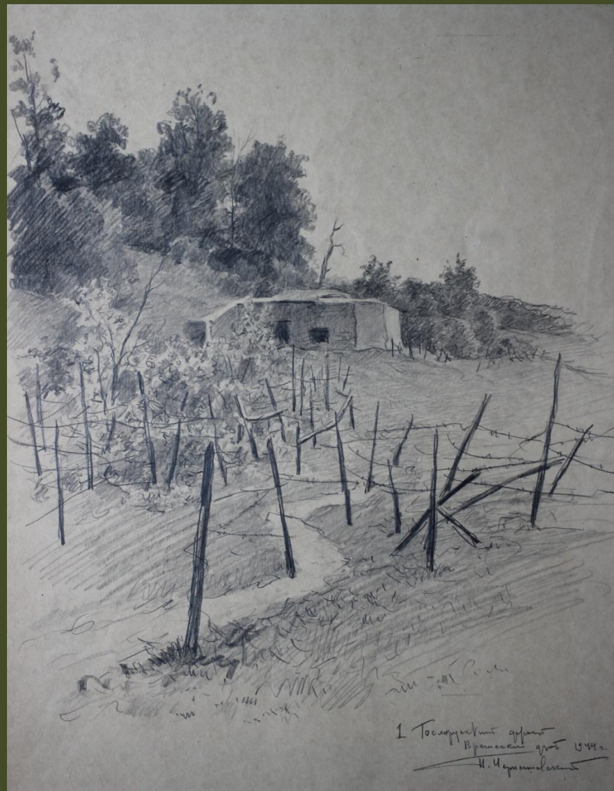
П.А. Чернышевский. Первый Белорусский фронт. Вражеский дзот. 1944 г.