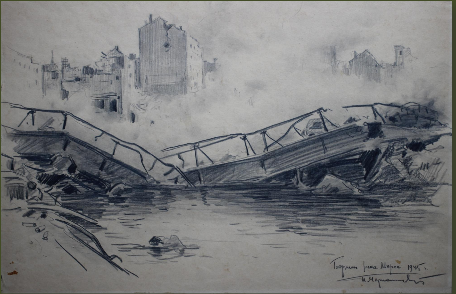
П.А. Чернышевский. Берлин. Река Шпрее. 1945 г.