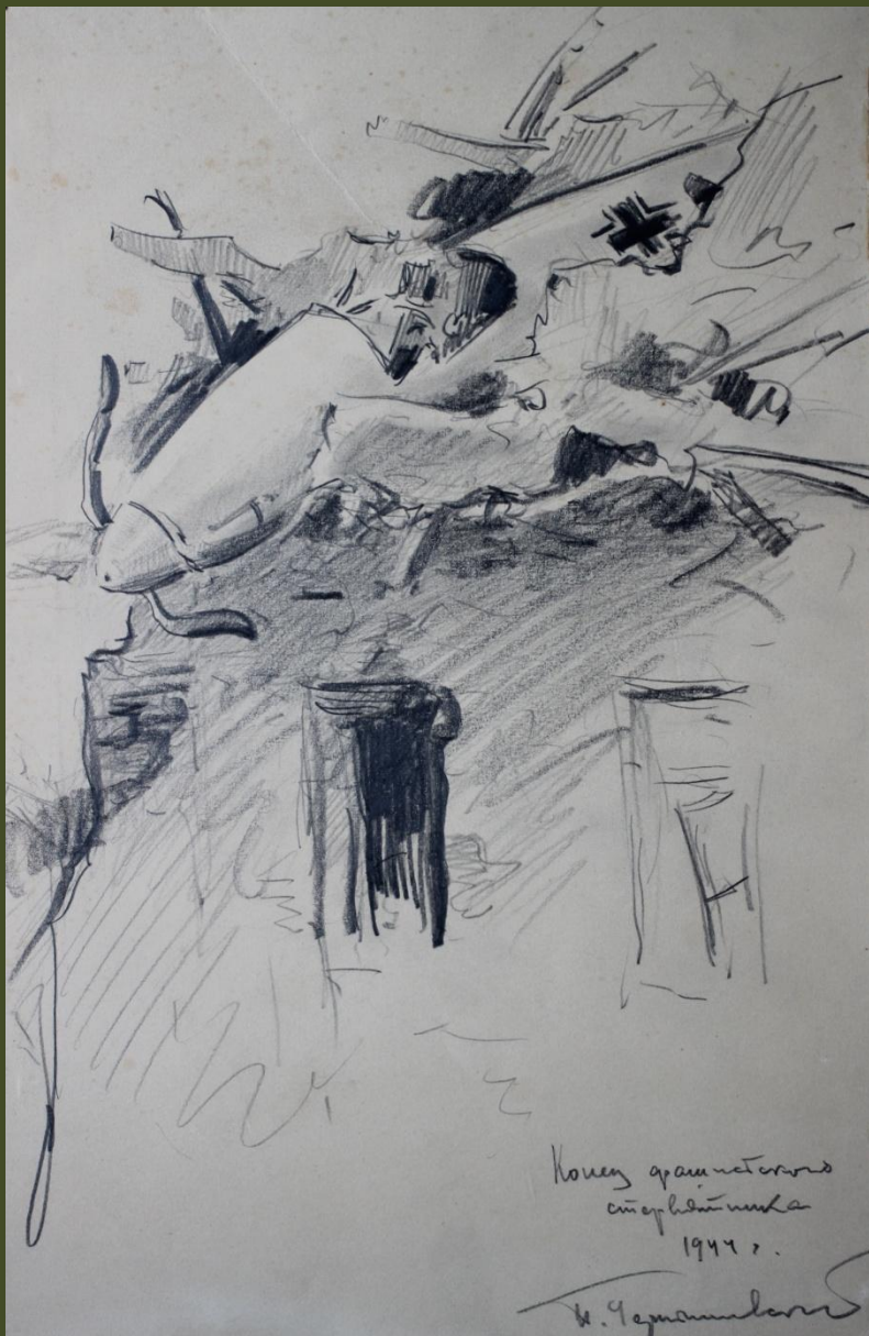
П.А. Чернышевский. Конец фашистского стервятника. 1944 г.