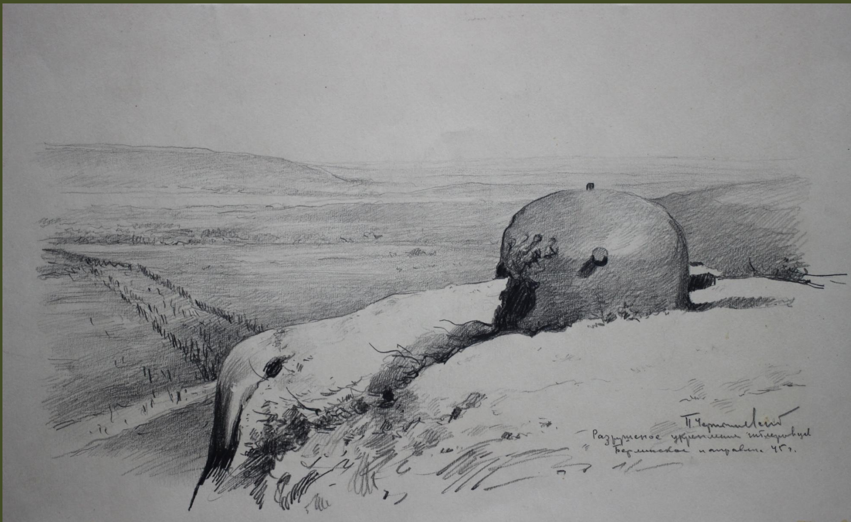
П.А. Чернышевский. Разрушенное укрепление гитлеровцев. Берлинское направление. 1945 г.