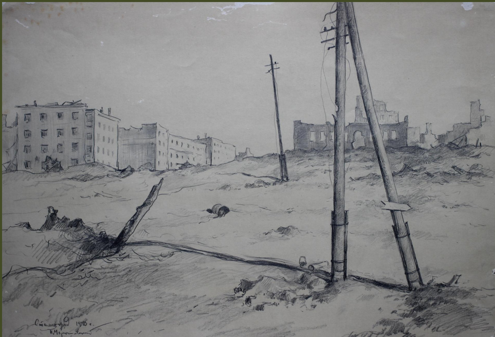
П.А. Чернышевский. Сталинград. 1943 г.