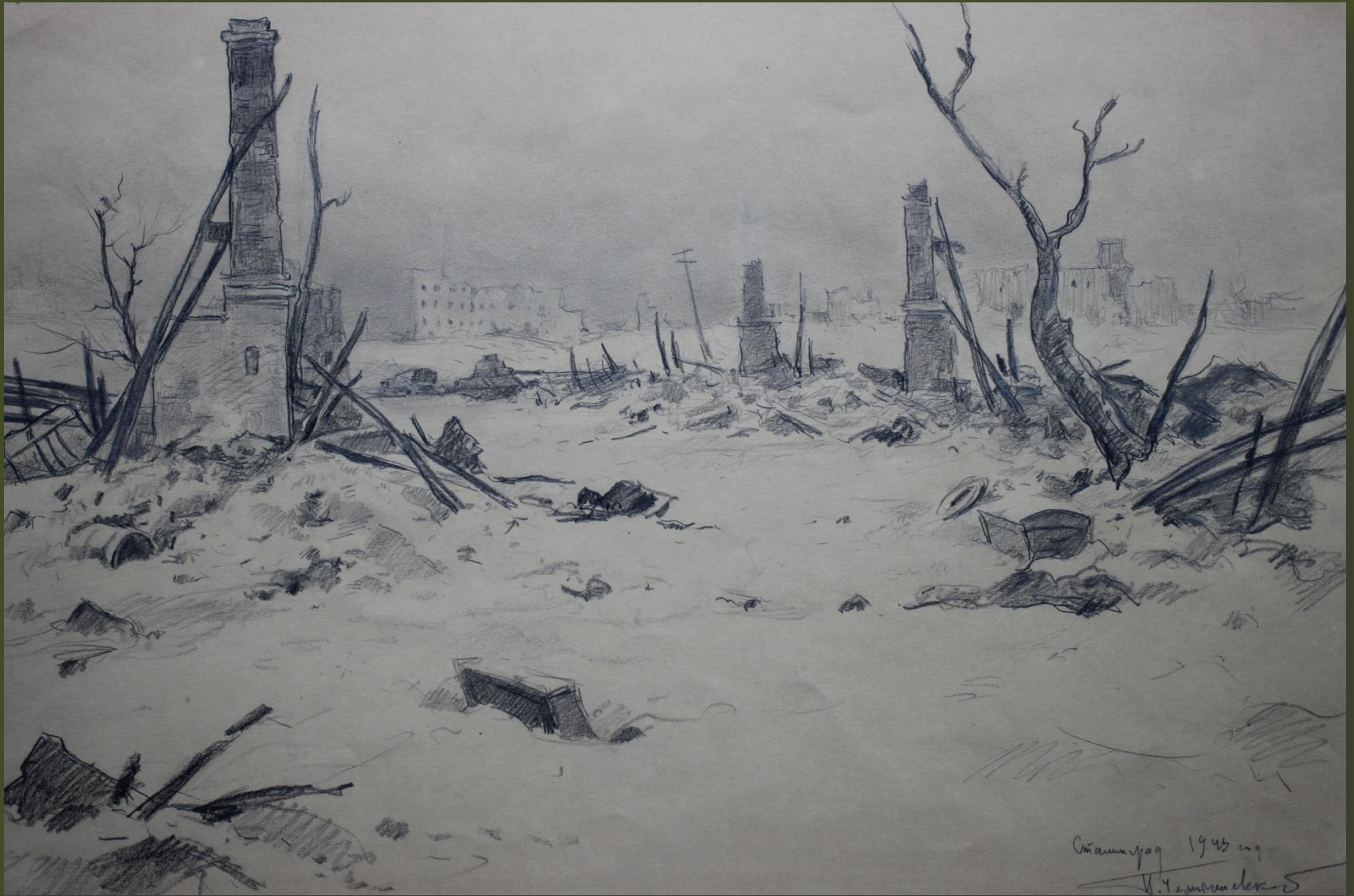
П.А. Чернышевский. Сталинград. 1943 г.