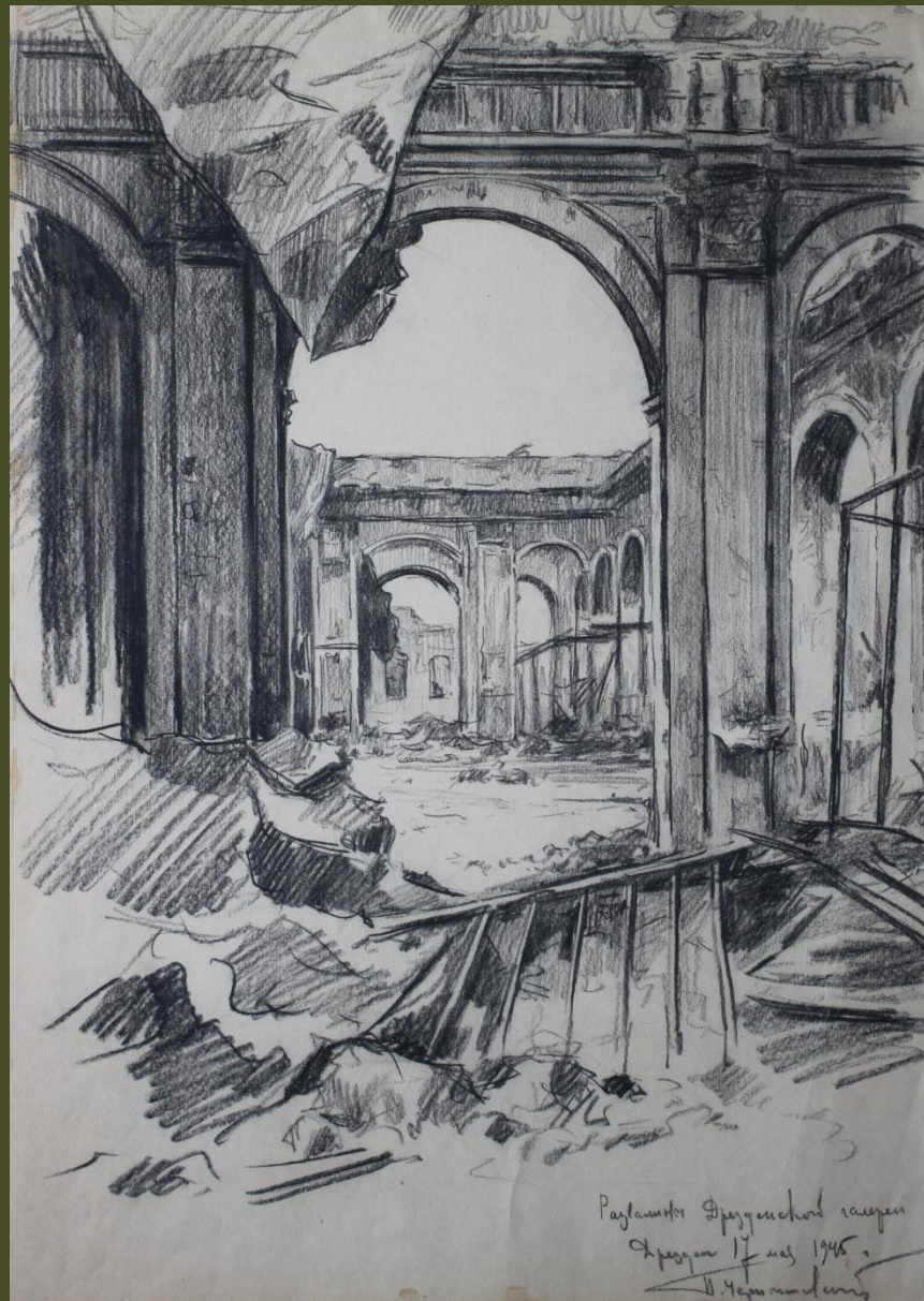
П.А. Чернышевский. Развалины Дрезденской галереи.