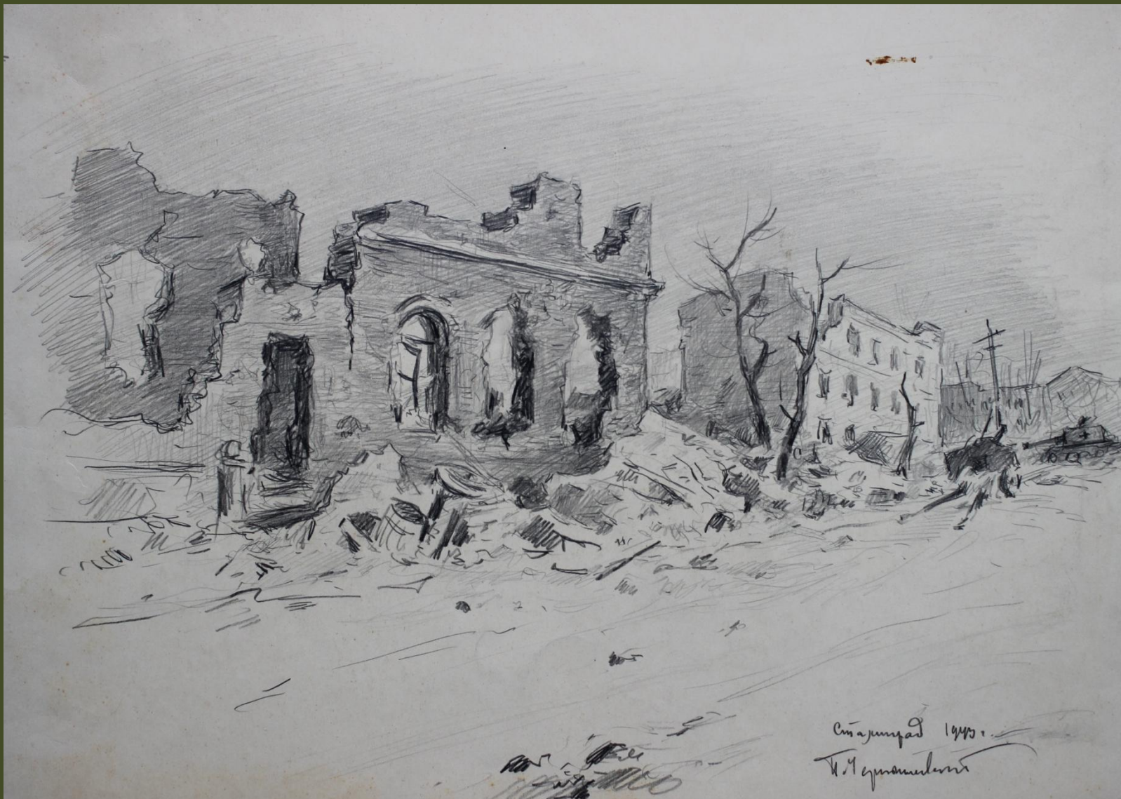
П.А. Чернышевский. Сталинград. 1943 г.