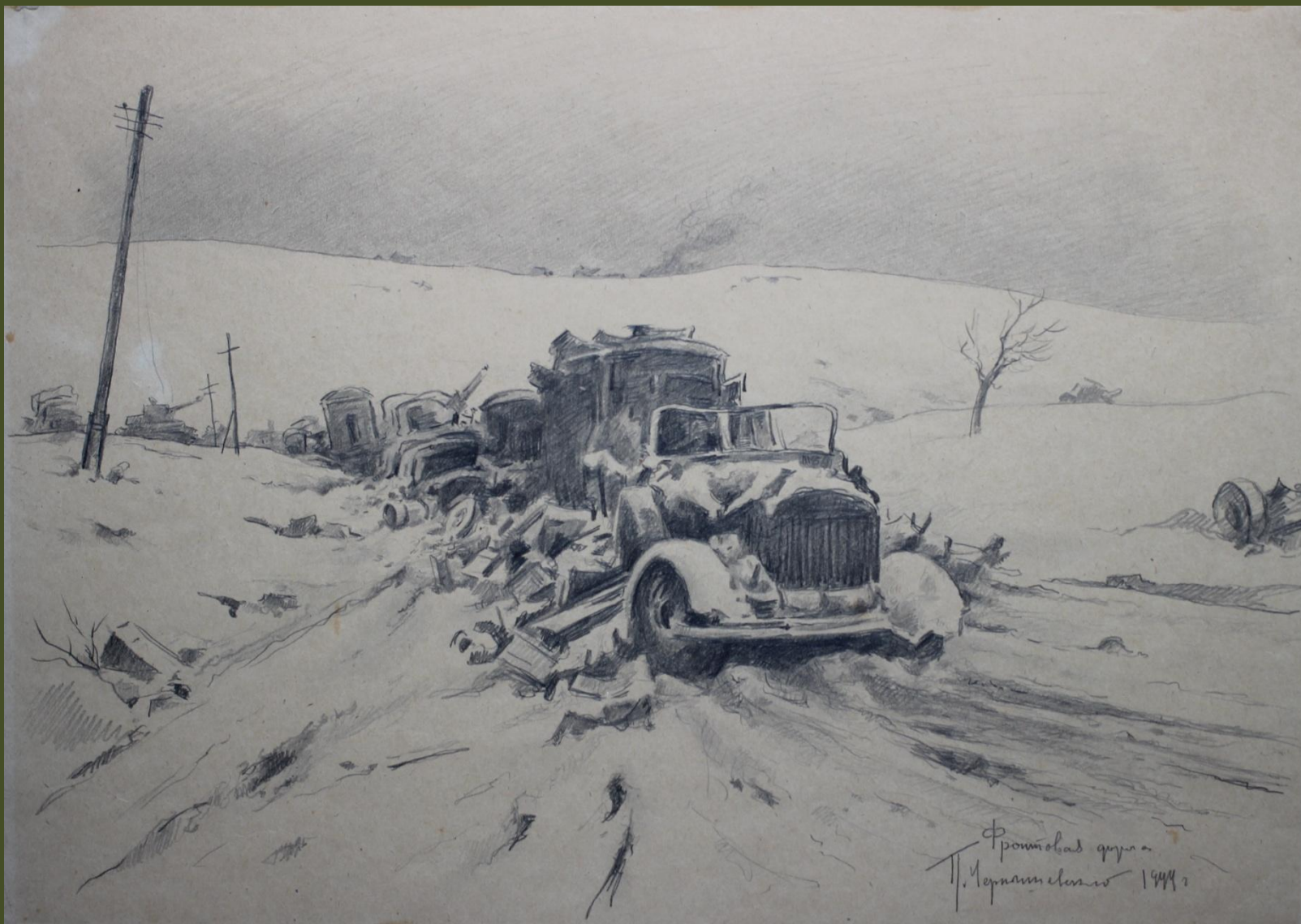
П.А. Чернышевский. Фронтальная дорога. 1944 г.