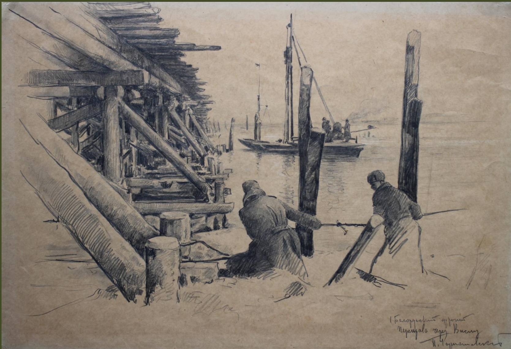
П.А. Чернышевский. Белорусский фронт. Переправа через Вислу. 1944 г.