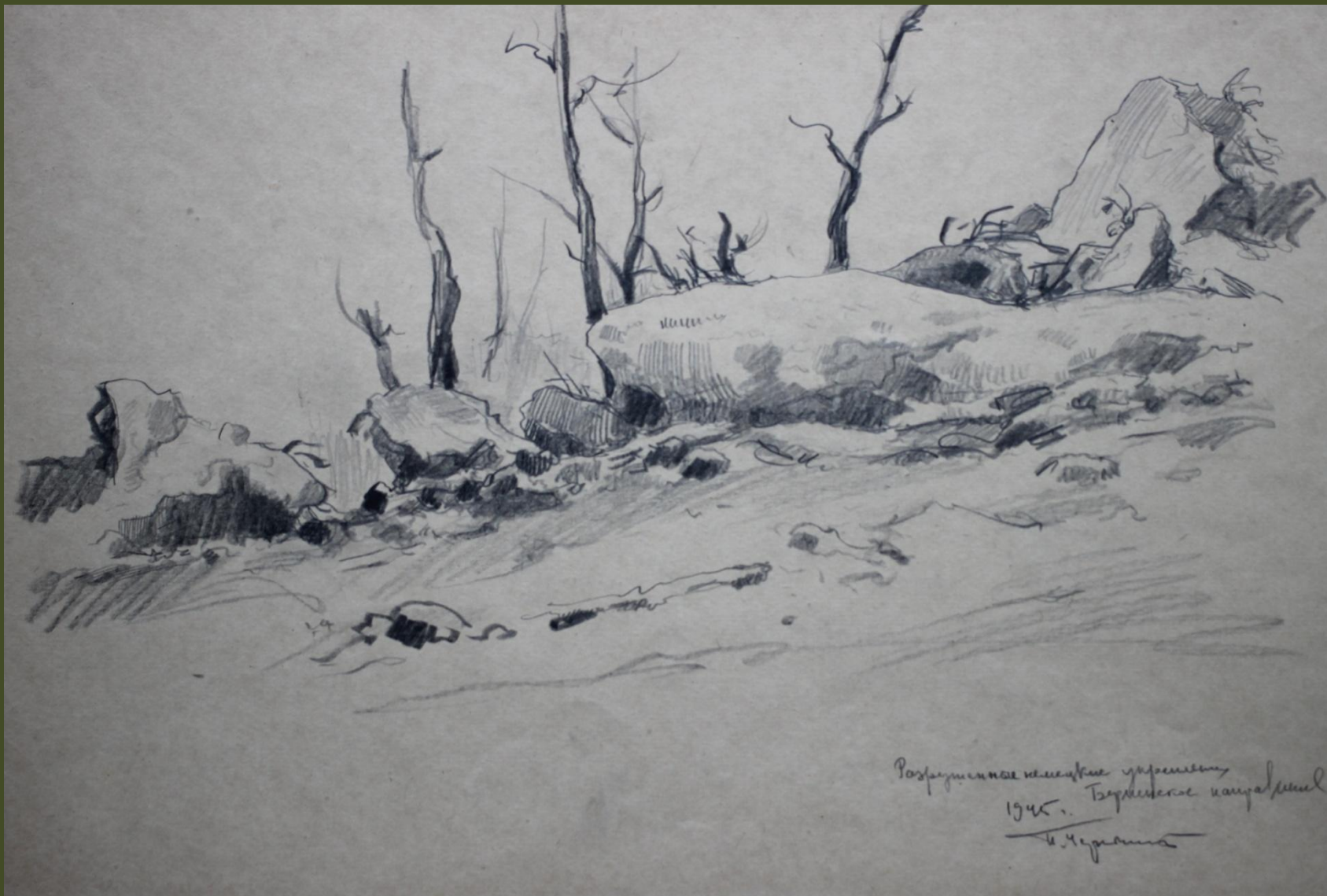
П.А. Чернышевский. Разрушенные немецкие укрепления. Берлинское направление. 1945 г.