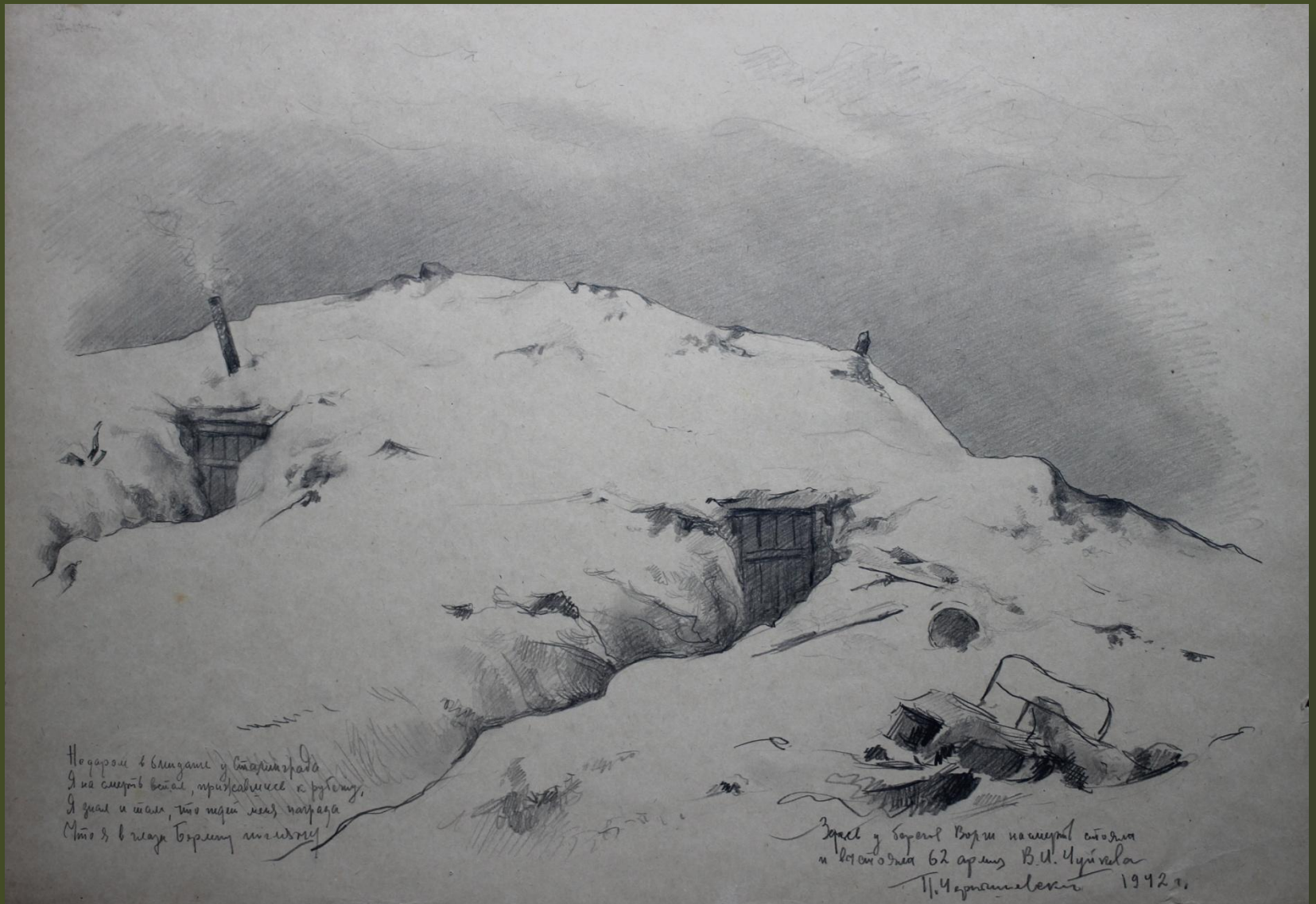
П.А. Чернышевский. Здесь у берегов Волги на смерть стояла и выстояла 62 армия В.И. Чуйкова. 1942 г.