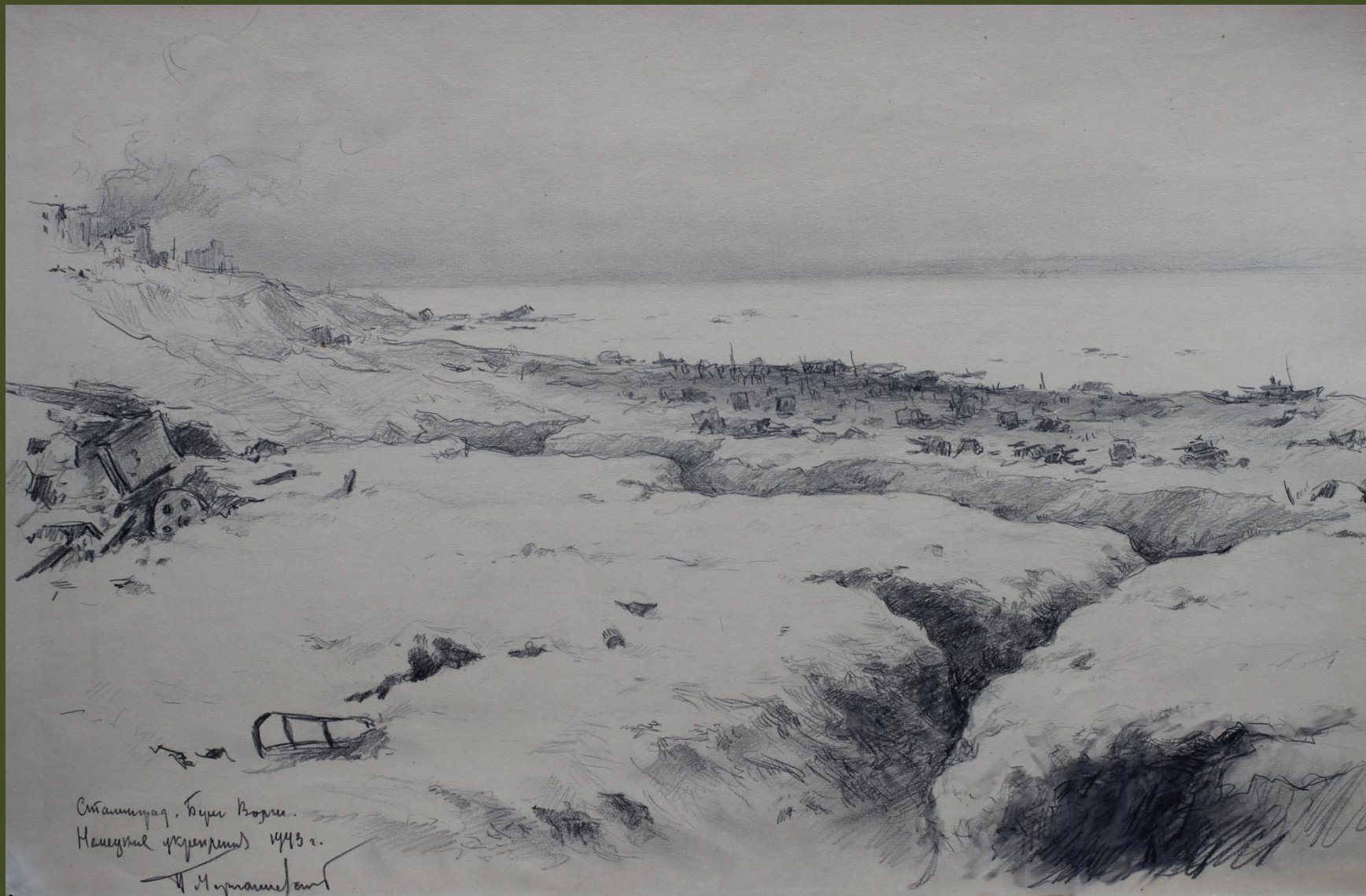
П.А. Чернышевский. Сталинград. Берега Волги. Немецкие укрепления. 1943 г.