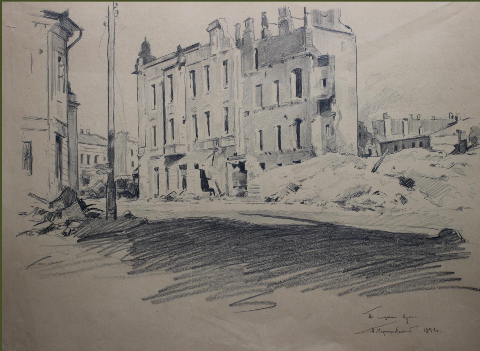
П.А. Чернышевский. По следам врага. 1944 г.