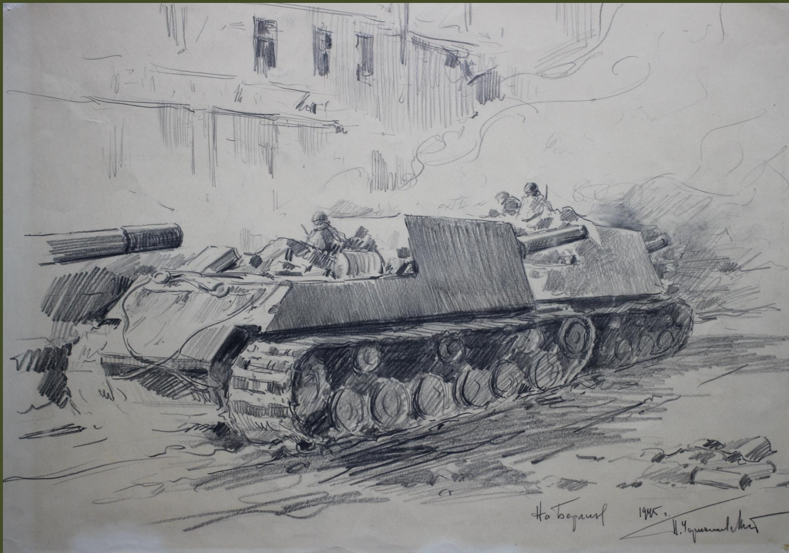
П.А. Чернышевский. На Берлин. 1945 г.