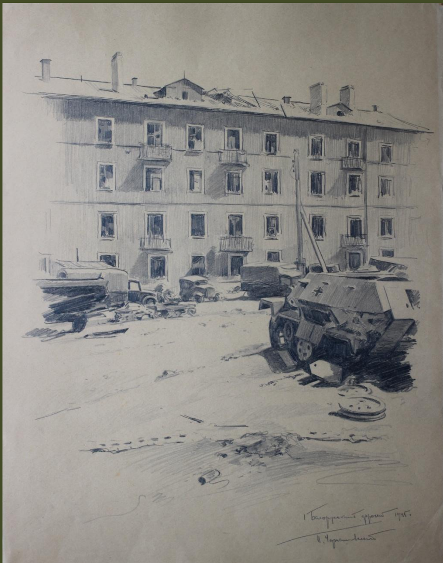
П.А. Чернышевский. Белорусский фронт. 1945 г.