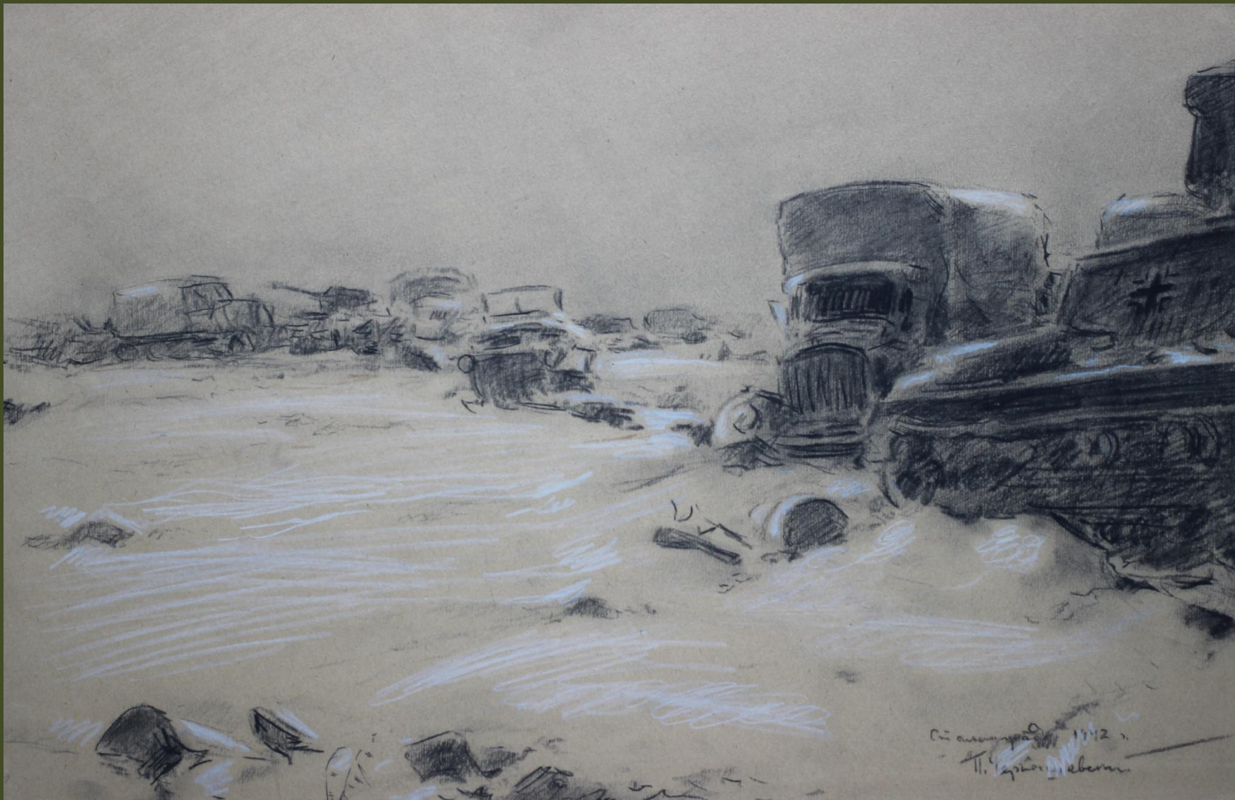
П.А. Чернышевский. Сталинград. 1942 г.