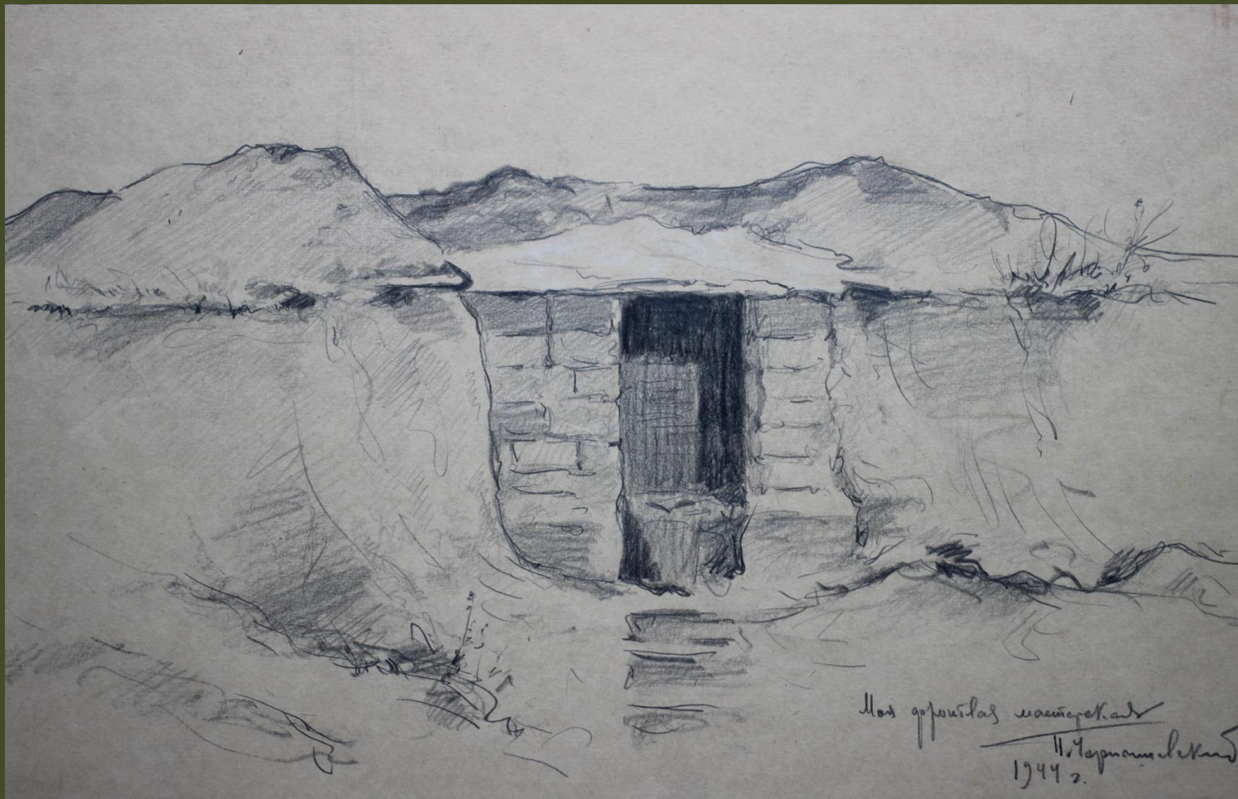
П.А. Чернышевский. Моя фронтальная мастерская. 1944 г.