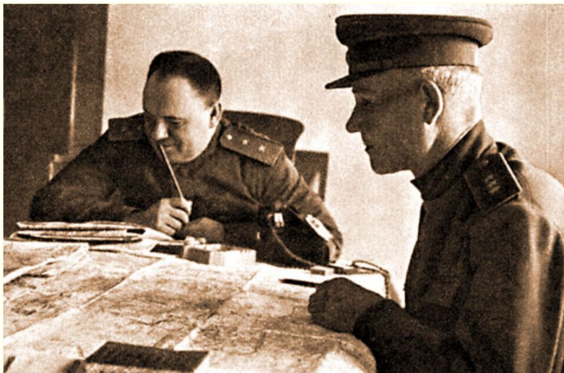
Командующий войсками Степного фронта И. С. Конев (справа) и начальник штаба М. В. Захаров. 1943 г