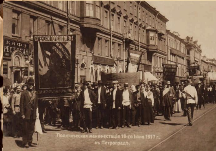
Политическая манифестация 18-го июня 1917 г. в Петрограде.

Однако в это же время в Петрограде начались антивоенные стачки и демонстрации, высказывающиеся против войны. Особенно широко это явление проявило себя в 1915 году: насчитано не менее 125 городских стачек с участием до 130 тыс. человек.