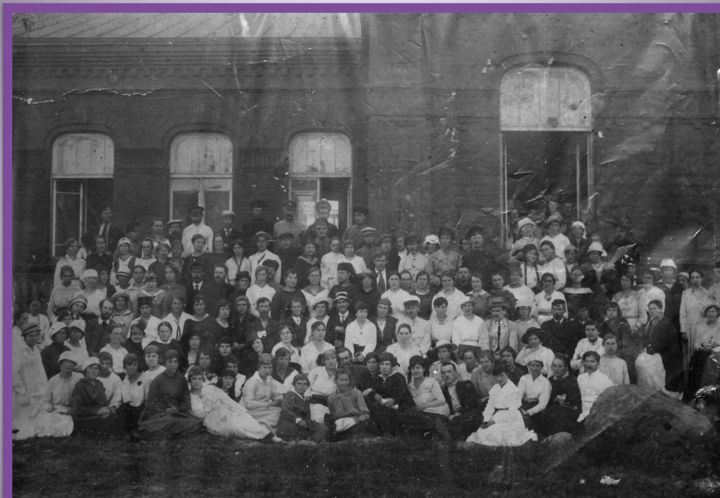
Конференция работников образования Великолукского района (20-е годы прошлого века) у здания бывшей школы № 6