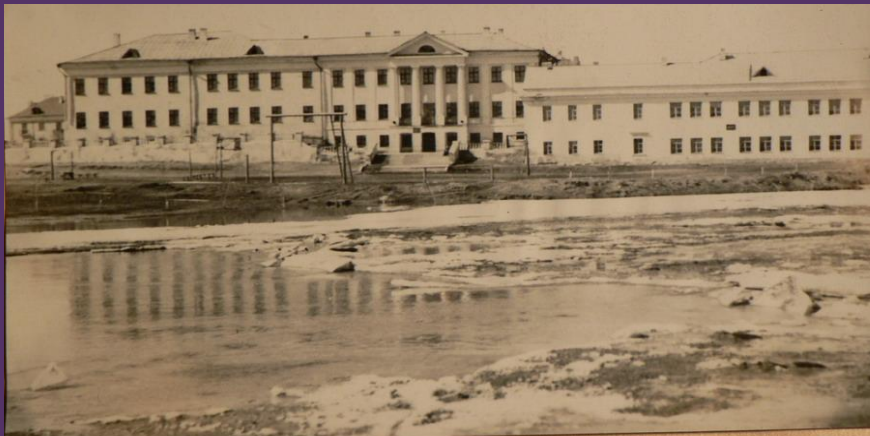
Школа №1 и приходское училище (школа №13) после Великой Отечественной войны.