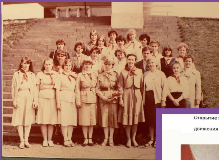
СТАРШИЕ ПИОНЕРСКИЕ ВОЖАТЧЕ ШКОЛ ГОРОДА НА ПРАЗДНИ ПИОНЕРИИ. 19 МАЯ 1967 г.