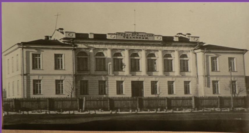
Великолужский педагогический техникум. 1932 год