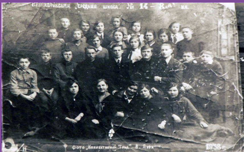
Фото "Коллективный Труд" В. Луки