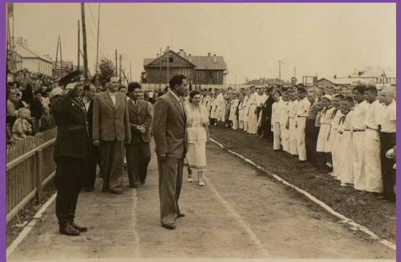
1957 год. Открытие слета юных пионеров. Приветствует пионеров зам. председателя обл-