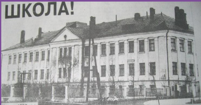
Школа. 1957 год