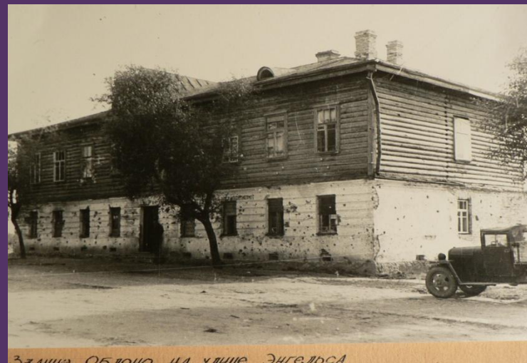
Здание Облоно на улице Энгельса.