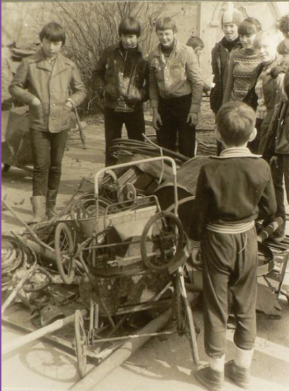
Дети КИДА "РОВЕСНИК" НА СБОРЕ МЕТАЛЛОМОА.