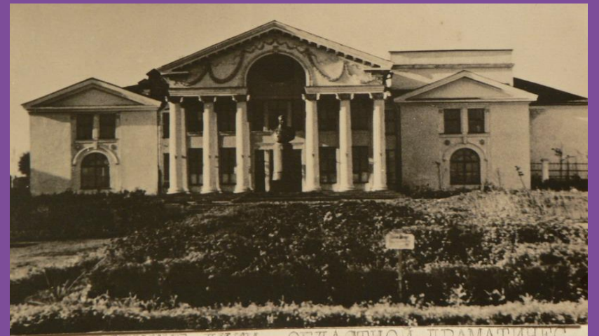
1956. ВЕЛИКИЕ ЛУКИ, ОБЛАСТНОЙ ДРАМАТИЧЕСКИЙ ТЕАТР.