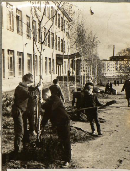
ПИОНЕРЫ 5-Х КЛАССОВ ЗАКЛАДЫВАЮТ БЕРЕЗОВУЮ АЛЛЕЮ У ШКОЛЫ №1, СЕНТЯБРЬ 1969 г.