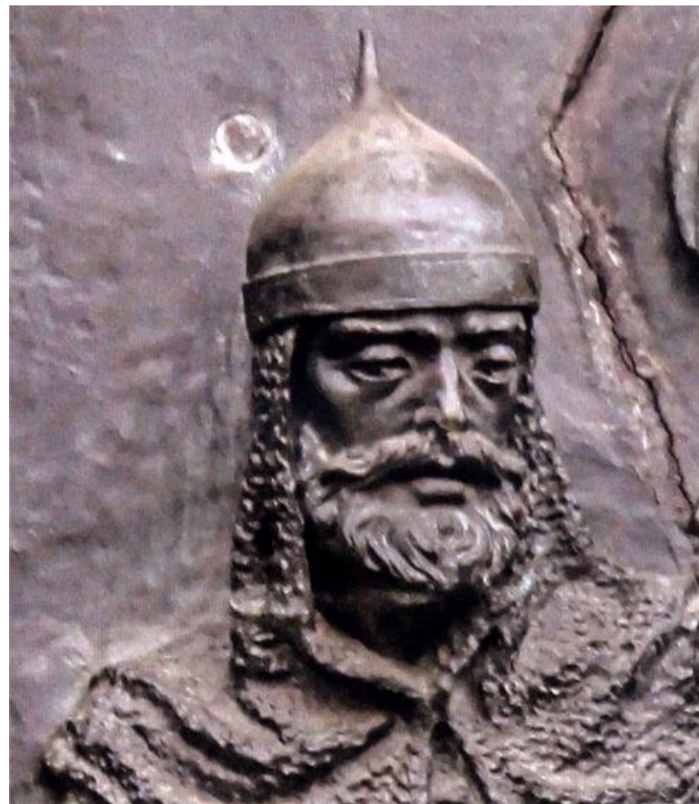
Сын Мстислава на памятнике «Тысячелетие России»

Мстислав сын Владимира I от полоцкой княжны Рогнеды. Его старшими братьями были Изяслав и Ярослав. Дедом по отцу был знаменитый князь-воитель Святослав (годы княжения в Киеве — 945 — 972). Прабабкой по отцу являлась княгиня Ольга. Дедом по матери Мстислав имел самостоятельного полоцкого правителя Рогволода. Рогволод и его дочь Рогнеда, скорее всего, были варяжского рода. Кроме родных братьев, у Мстислава имелось еще и 9 сводных братьев, ведь Владимир до своего крещения обладал 8 женами и бесчисленным «штатом» наложниц.