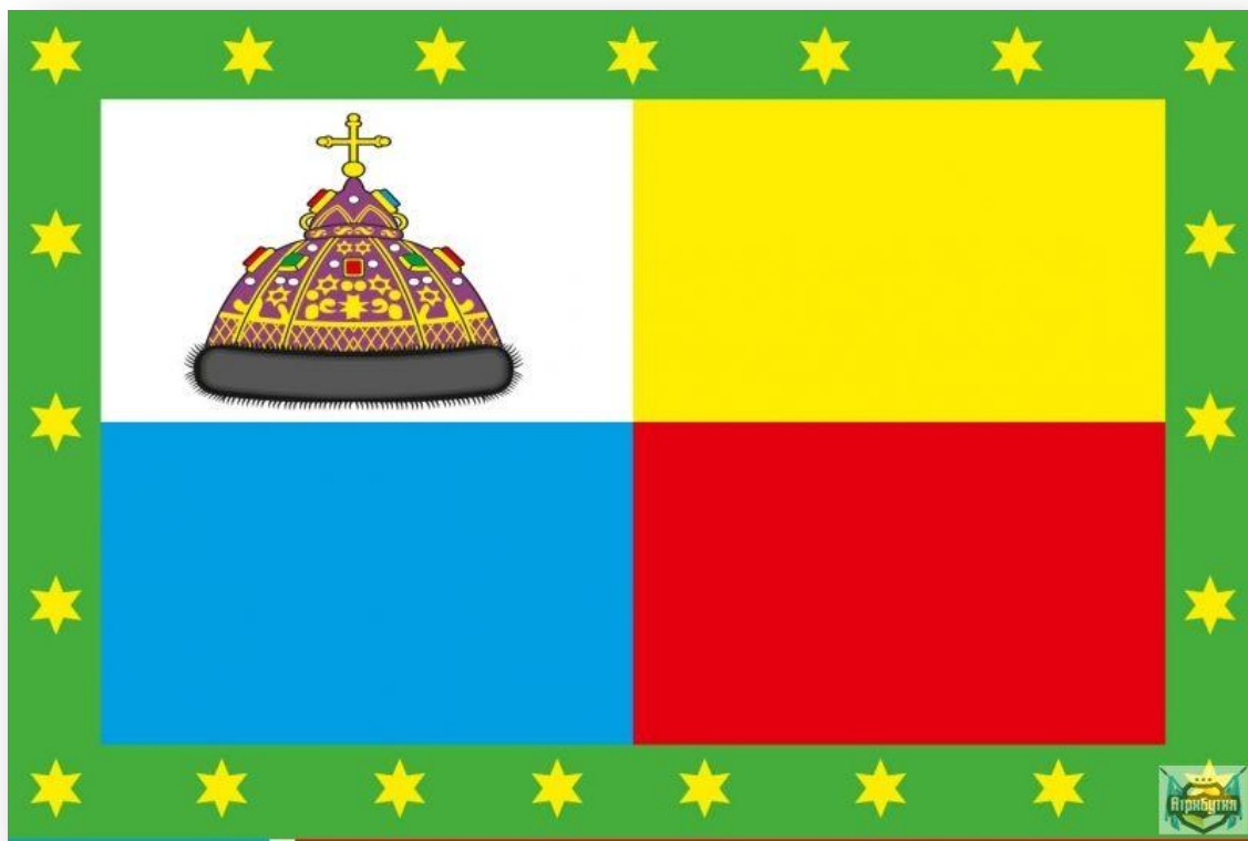
Флаг Тмутараканского княжества