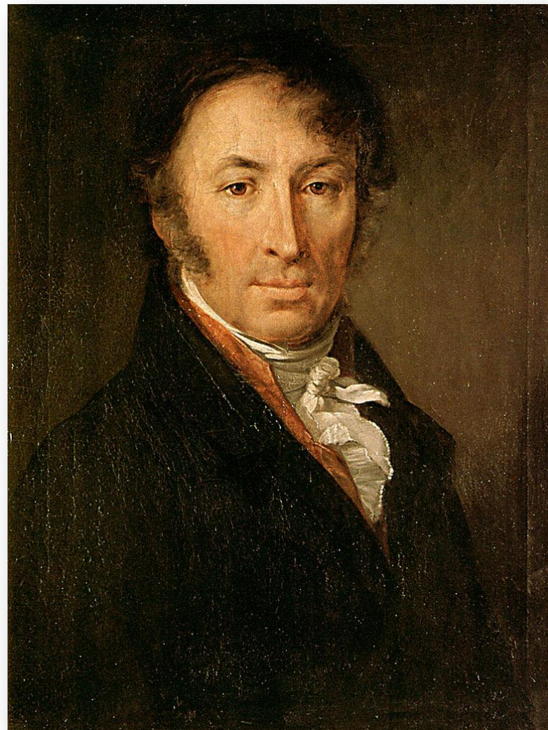
Портрет Карамзина кисти Тропинина (1818)

Летописец писал о Мстиславе: «Был же Мстислав дороден телом, румян, с большими глазами, храбр был в бою, милостив и очень любил дружину, имущества для нее не жалел, ни в питье, ни в пище не ограничивал ее».