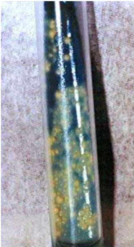
Kolonije Mycobacterium tuberculosis na čvrstoj Löwenstein-Jensen podlozi.