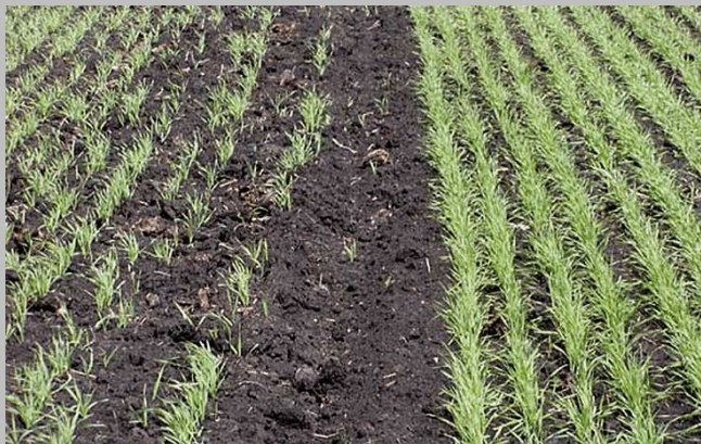
всходы и кущение