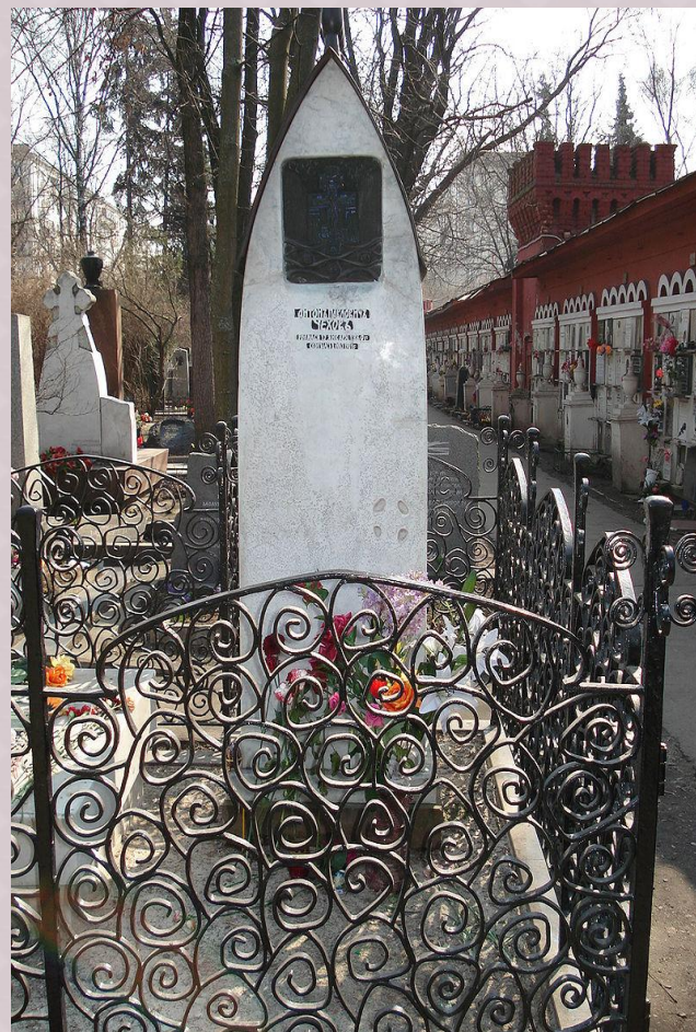
Москва, Новодевичье кладбище