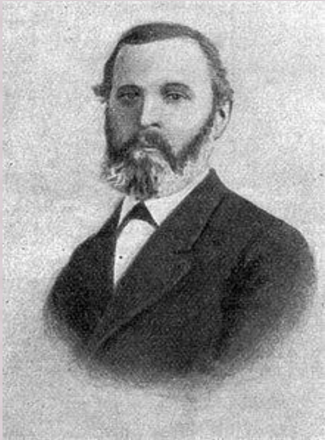
Павел Егорович Чехов (1825—1898)