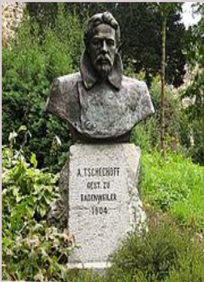
Памятник в Баденвайлере