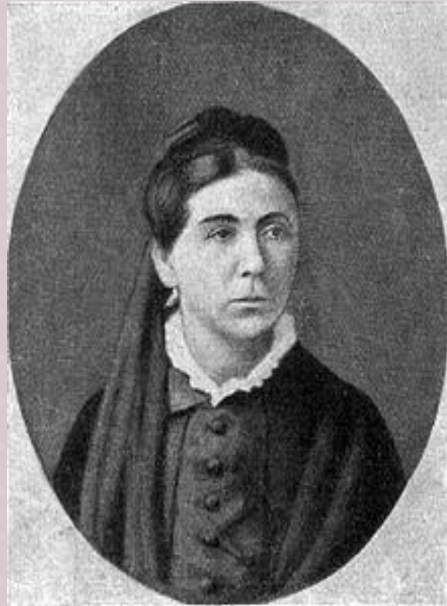
Евгения Яковлевна Чехова (1835—1919)