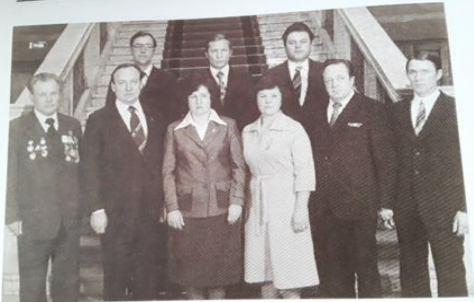
XXI Челябинская областная партийная конференция.