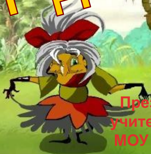
Таблица умножения и деления на

Презентацию выполнила: учитель начальных классов МОУ Кантемировской СОШ