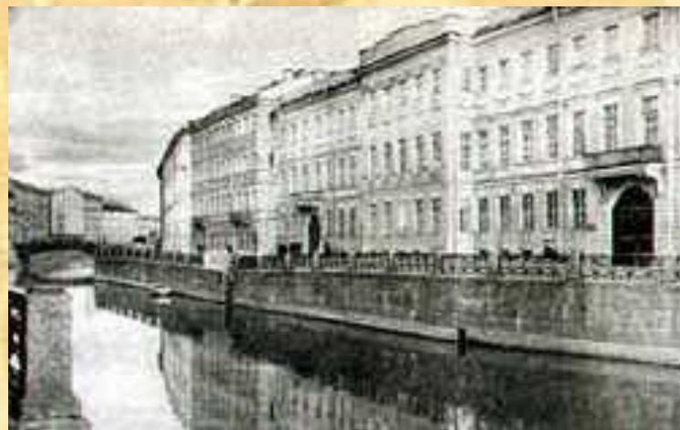
Квартира Пушкина в Петербурге на Набережной Мойки

С середины октября 1831 г. и уже до конца жизни Пушкин с семьей живет в Петербурге.